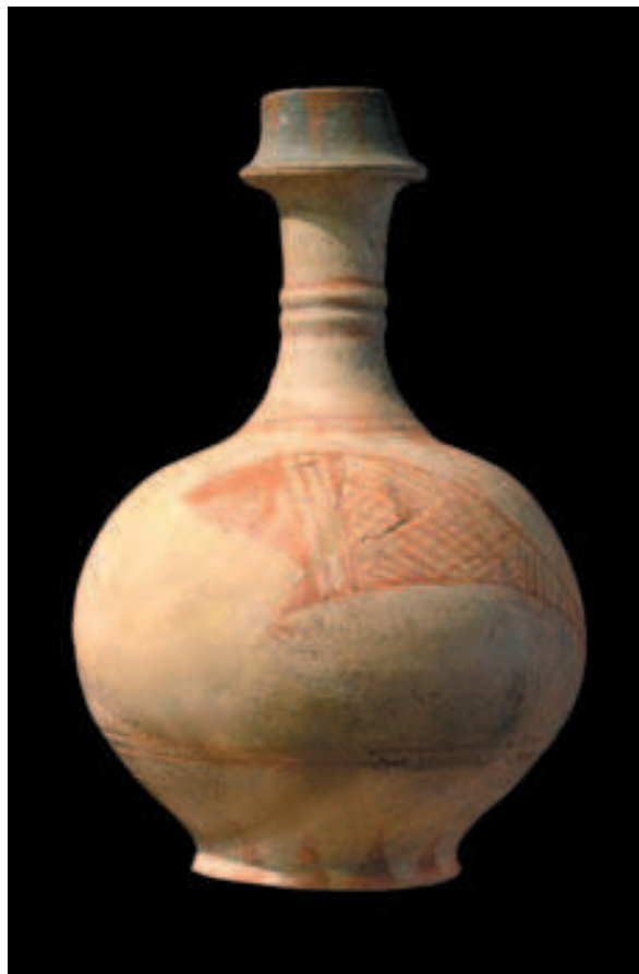
Kapela sv. Dizme, oslikana keramička posuda