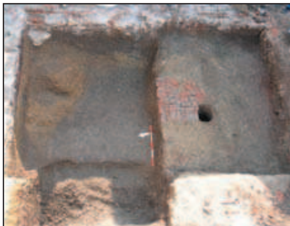
Na sjevernom dijelu (P2) prvi dio iskopa jame sa zapunom iz 17 st.; na južnom dijelu popločenje od opeke

Krajem srpnja i početkom kolovoza 2005. Muzej grada Zagreba proveo je zaštitno arheološko istraživanje prilikom konzervatorsko-građevinskog zahvata na objektu u