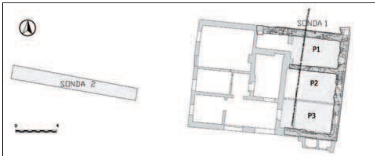
Pozicija sonde (izradio: J. Burmaz)

Samo iskopavanje provedeno je tako da je gornji sloj šute i građevinskoga recentnog materijala uklonjen strojno, nakon čega je započeo ručni iskop. Tijekom istraživanja također je rabljen stroj prilikom odstranjivanja debelog sloja novovjekog nasipa. Slojevi su iskapani stratigrafskim slijedom te dokumentirani opisno, fotografijom te u obliku fotokice (referencirana fotografija uz pomoć geodetskog mjernog instrumenta – totalne stanice).