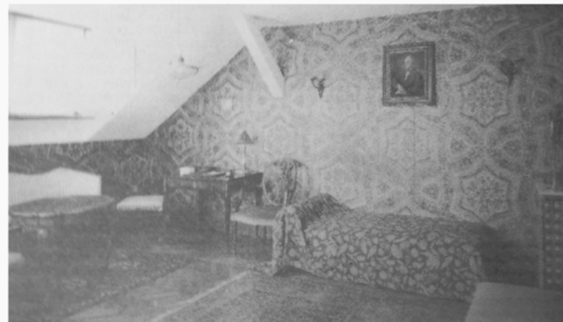
Soba za rad i razgovor u svojoj raskoši