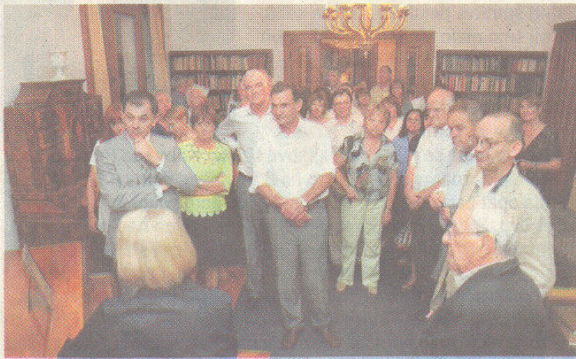
Memorijalni prostor Bele i Miroslava Krleže