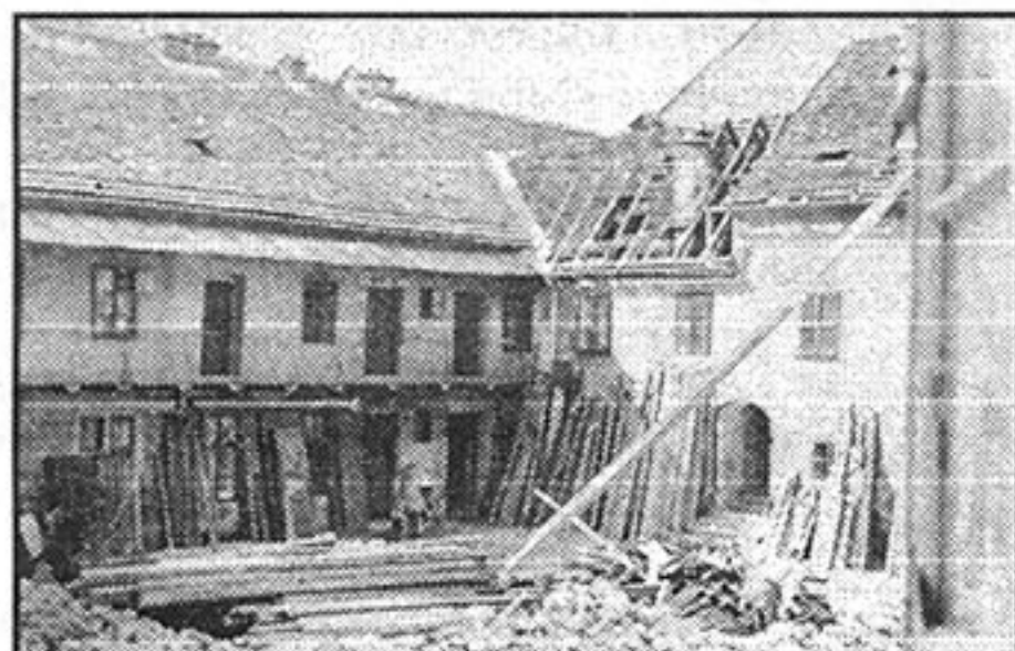
Rušenje samostanskog kompleksa 1941. godine

Gradski magistrat darovao je na samom početku 17. stoljeća – 1607. godine – crkvu »napuštenu od redovnica« koja se nalazila nedaleko njihova »ruševnog« samostana isusovcima, kako bi