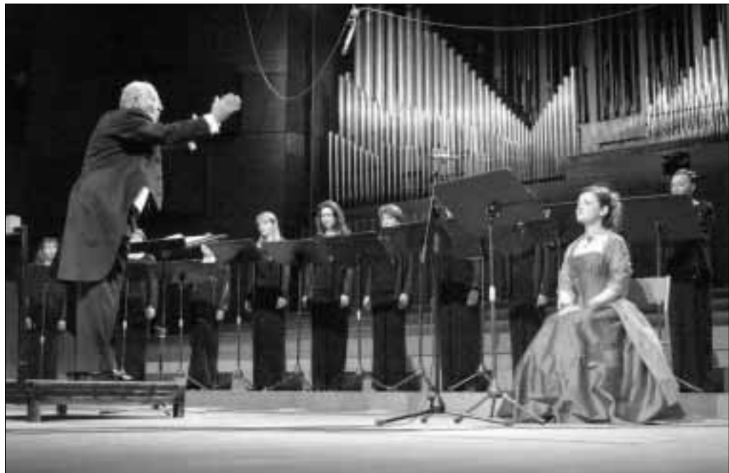
Objeltnički koncert: S prazvedbe Papandopolove »Podnevne simfonije«