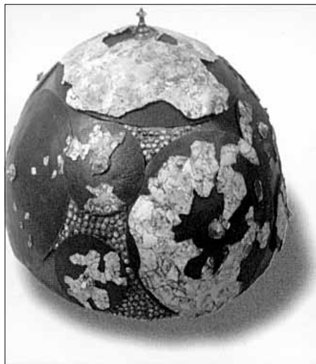
Zdjelasta kaciga otkrivena na lokalitetu Budinjak

ZAGREB, 24. travnja – Izložba »Oživljene kulture – arheološka otkrića na Žumberku« bit će otvorena u četvrtak u galeriji Cankarjevog doma u Ljubljani. Riječ je o izložbi kojom Arheološki muzej Zagreb i Muzej grada Zagreba predstavljaju rezultate iskopavanja u Žumberku proteklih 20-ak godina, a autori su joj Zoran Gregl i Želimir Skoberne. Prve vijesti o arheološkim nalazima na Žumberku datiraju u 19. stoljeće, a sustavna istraživanja počela su tek 1982. kada arheolozi istražuju ranocarsku nekropolu na položaju kod sela Gornja Vas u kojoj je otkriveno paljevinsko groblje koje je dalo nalaze urni u obliku kuće i gotovo potpuno sačuvane staklene urne. Otkriveno je još nekoliko sličnih nekropola u selu Bratelji dok je lokalitet Mrzlo polje u početnoj fazi istraživanja. Izložba pokazuje i nalaze s prapovijesnog grobišta kod sela Budinjak što taj lokalitet stavlja u red vodećih u ovom dijelu Europe. K. R.