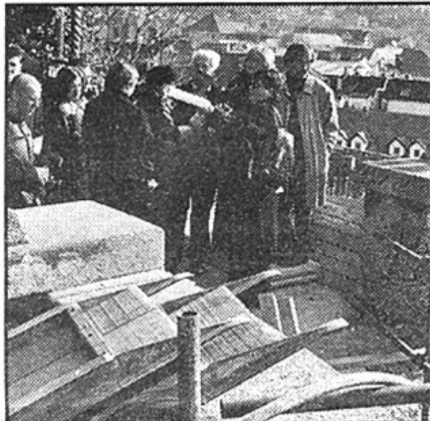
Gradonačelnica na Strossmayerovom šetalištu