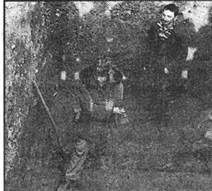
Pronađeni temelji ispod parka na Griču