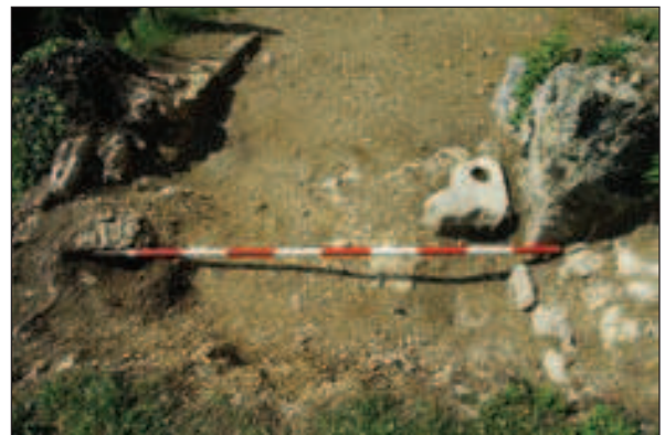
Otvor vrata s kamenim ulomkom u kojem je utor za pant vrata