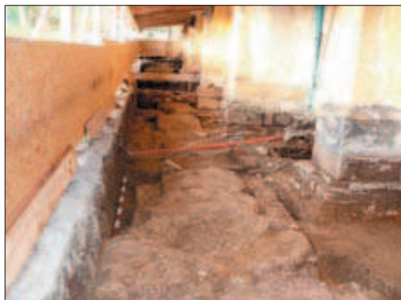
Nalazna situacija uz južno pročelje crkve

Muzej grada Zagreba 2007. proveo je sondažna arheološka istraživanja uz južno pročelje crkve uznesenja Blažene Djevice Marije u Remetama. Radovi su izvedeni u okviru realizacije projekta odvodnje oborinskih voda i drenaže uz istočno i južno pročelje crkve.