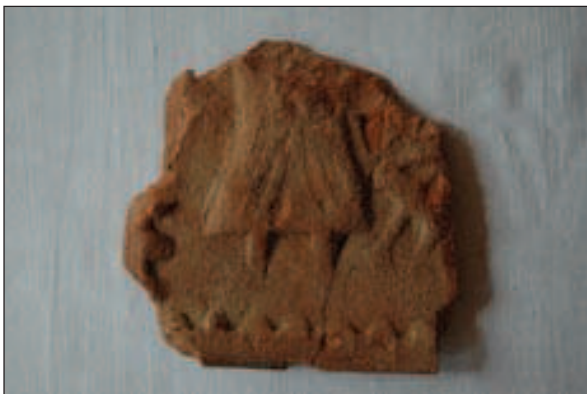
Glinena pločica s reljefnim ukrasom

U 2007. godini započelo je iskopavanje na zapadnoj padini koje se nadovezalo na istraživanja prethodne godine. Na zapadnoj padini pronađen je dio zida koji se spušta od sjeverozapadnog ugla palasa niz zapadnu padinu, smjer istok-zapad. Kako su se na tom dijelu zida palasa odvijali zaštitni konzervatorski radovi, zbog opasnosti od oštećivanja zid nije u potpunosti otkriven. Pronađeni zid iskopan je do dubine od 50 cm, te je prekriven geotekstilom i zatrpan sipkim materijalom radi zaštite tijekom navoženja materijala. Od arheološkog materijala pronađena je manja količina keramike, čavala i stakla. U vanjskom dvorištu ispod kamenog luka dovratnika pronađena je glinena pločica