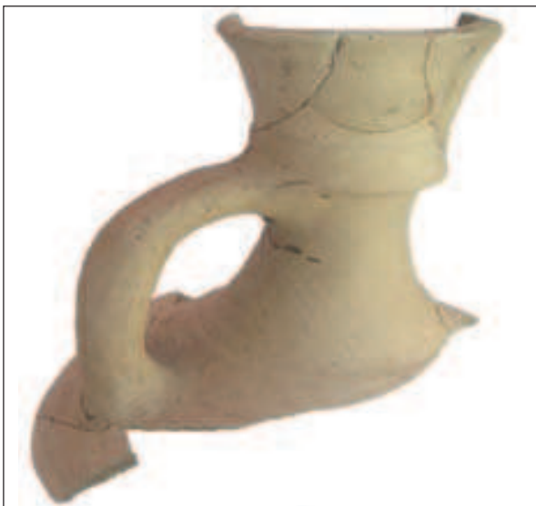
Zagreb, Tkalčićeva ulica, sonda II, fragment vrča s dna potoka Medveščak

Sonda IV otvorena je nasuprot današnjemu kućnom br. 69, na mjestu spajanja Miklaušičeve, Tkalčićeve i Medvedgradske ulice. Sonda je bila ispražnjena do 129,00 m n.m., na razini sterilnoga sloja sa šljunkom i oblucima, a iskopan je recentni nasip šljunka, pijeska i šute. Premda je iskopana relativno velika površina, bilo je izuzetno malo pokretnih arheoloških nalaza.