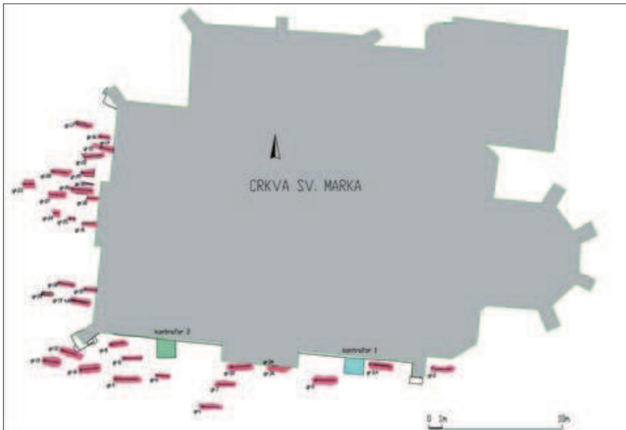
Dispozicija grobova uz crkvu sv. Marka (izradila: A. Bugar)

nekoliko otpadnih jama i nasebinskih objekata u kojima je vidljiva njihova višekratna uporaba i prenamjena prostora. Indikativan je nalaz listolikoga brončanog koplja pronađenog u Jami 397 koje nedvojbeno pripada najstarijoj fazi uporabe jame, prepoznatljivoj prema karakterističnoj boji i konzistenciji zapune.