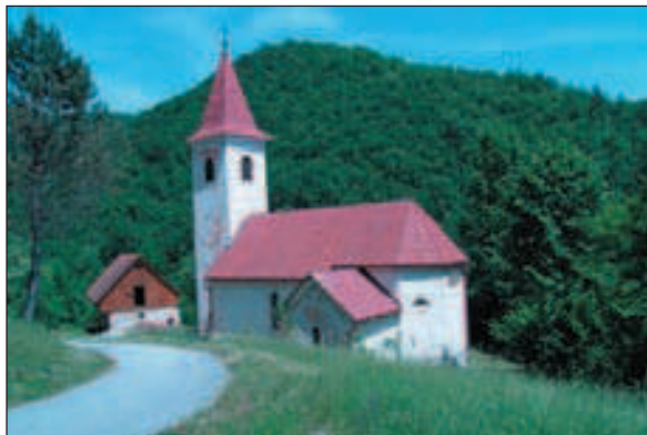
Župna crkva sv. Nikole biskupa

Župna crkva sv. Nikole biskupa (selo Žumberak) podignuta je 1654. godine. Crkva je jednobrodna, orijentirana u smjeru SZ-JI. Na južnoj strani zaključena je poligonalnim svetištem, iza zapadnu stranu nalazi se sakristija, a na sjevernom, glavnom pročelju zvonik. U crkvu se ulazi kroz prizemlje zvonika, rastvoreno s triju strana polukružno završenim otvorima. S istočne strane prizemlja zvonika