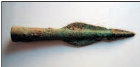
Brončano koplje iz Jame 397

Buntak 1996 Franjo Buntak, Povijest Zagreba, Zagreb, 1996.