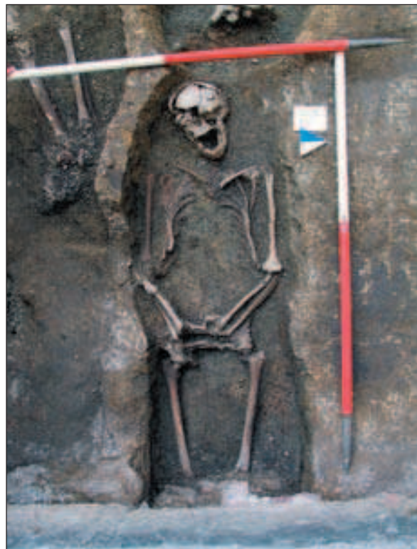
Nalazna situacija Groba 14

Istraživanja su potvrdila stratigrafsku sliku dobivenu u radovima 2005. godine. Iz prapovijesnog razdoblja definiran je još čitav niz ukopa pripisanih halštatskoj kulturi starijega željeznog doba, potvrđujući tako postojanje naselja toga vremena na cijelom platou današnjega Gornjega grada. Sumnju u postojanje starijega naseobinskog horizonta (kasnobrončanodobnoga) potvrdio je nalaz