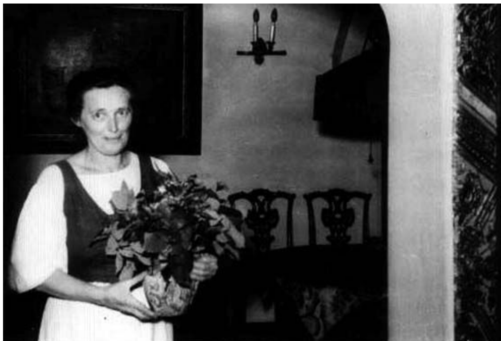
Slika 8. Terezija Kovačić, rođena Arhanić

Grand prix na svjetskoj izložbi dekorativnih umjetnosti u Parizu, 1925. Osim što je bio plodni i utjecajni arhitekt, Kovačić je radio i kao predavač na Visokoj tehničkoj školi u Zagrebu.