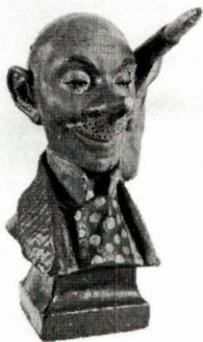
Reklamna glava Penkala , 1911.