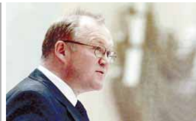
Goeran Persson podnio je zahtjev za rastavom nakon šest godina braka