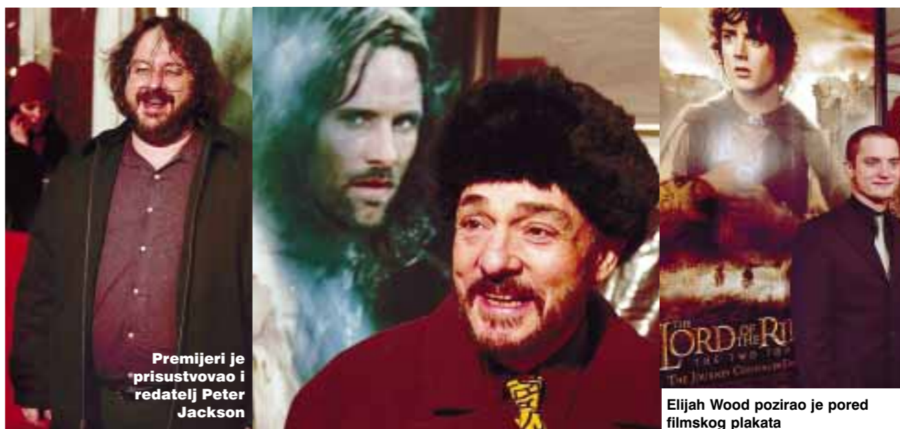
Premijeri je prisustvovao i redatelj Peter Jackson

»Ako mi platiš novac koji duguješ, neće biti parnice«, poručio je otac kćeri nazvavši je pritom »zlatom«. »Volio bih posljednje godine života provesti na nekom brodu, a ovako nemam sredstva. Pa, plati zlato«. P.B.