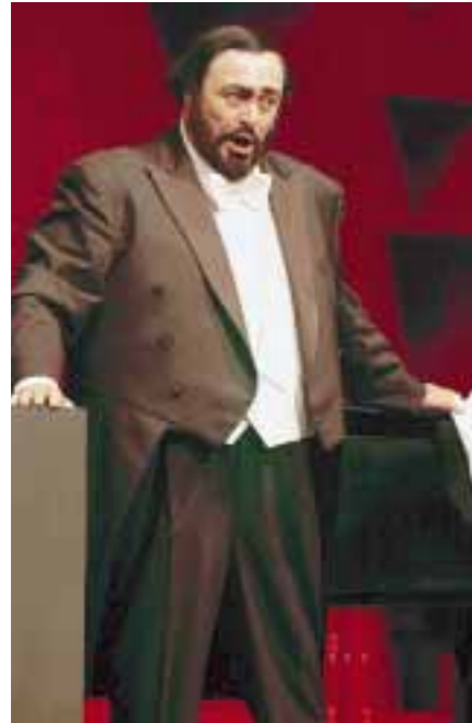
Uskoro ponosni otac blizanaca - Luciano Pavarotti

LONDON, 6. prosinca – Tri tenora odgodila su američki koncert koji se trebao održati u tjednu u kojem bi životna suputnica Luciana Pavarottija trebala roditi blizance.