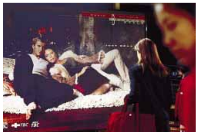
Beckham je u svijet reklama »ubacio« i svoju suprugu Victoriju Posh Spice