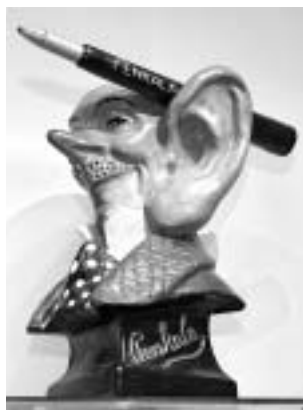
Kad se gleda opipom: Poznati reklamni kipić »Penkala«

U Muzeju se nadaju da će njihov primjer potaknuti i srodne ustanove, tim više što je 2005. proglašena godinom društvene odgovornosti. Obilježavanju su u ovom slučaju financijski pridonijeli glavni pokrovitelji projekta Zagrebačka banka te Ministarstvo kulture i Gradski ured za kulturu grada Zagreba.