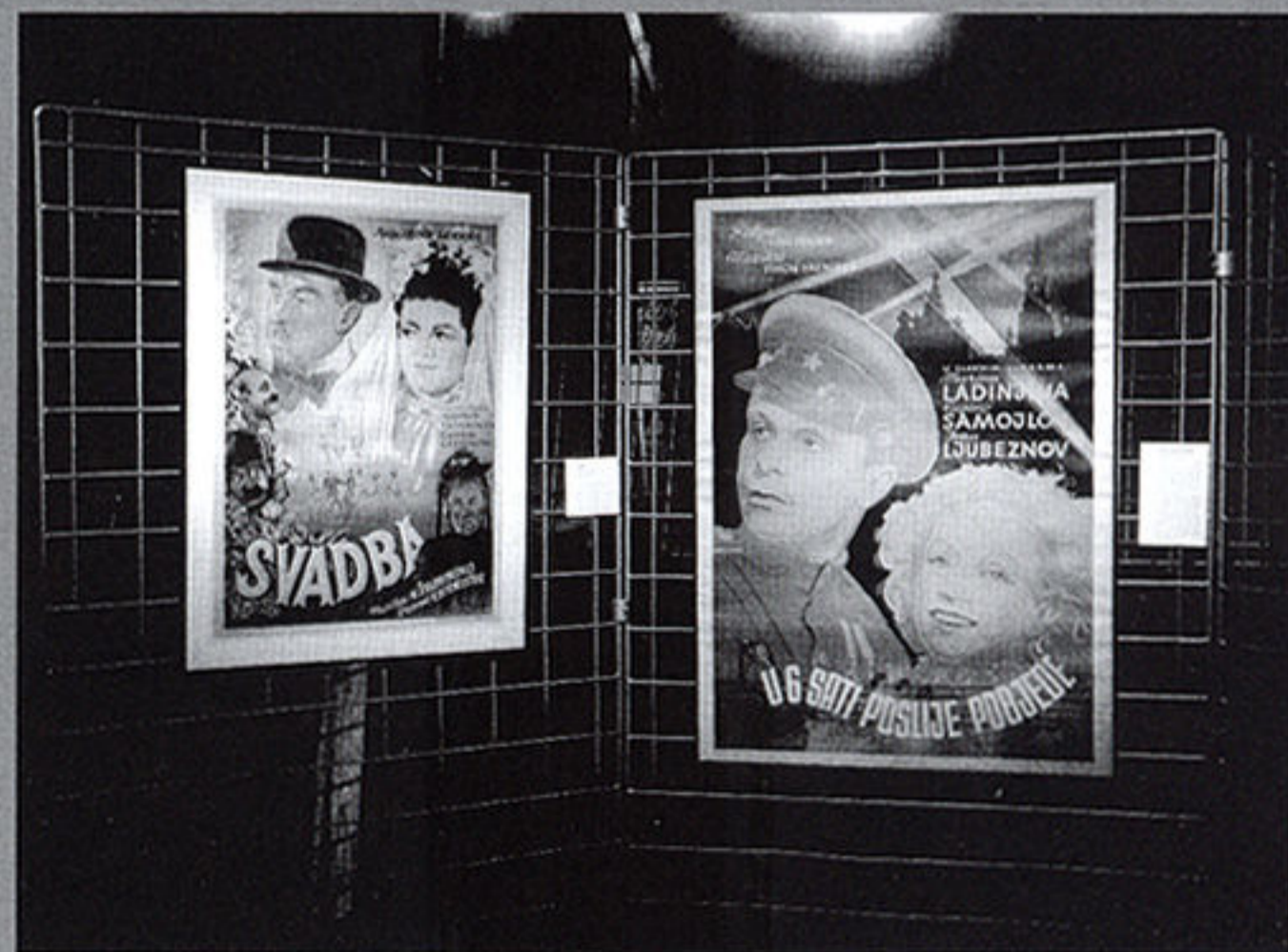
Detalj s izložbe u Muzeju grada Zagreba