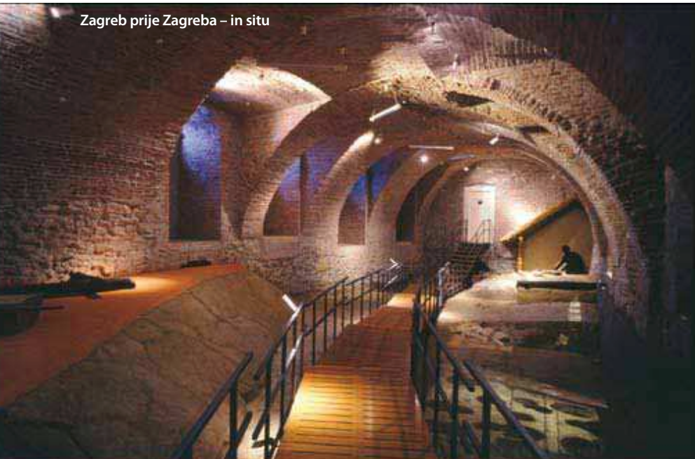
Zagreb prije Zagreba – in situ

prvi put je registrirana u slikarevu opusu i jedini je primjer slikanog portreta gradonačelnika Zagreba s počasnim lancem!