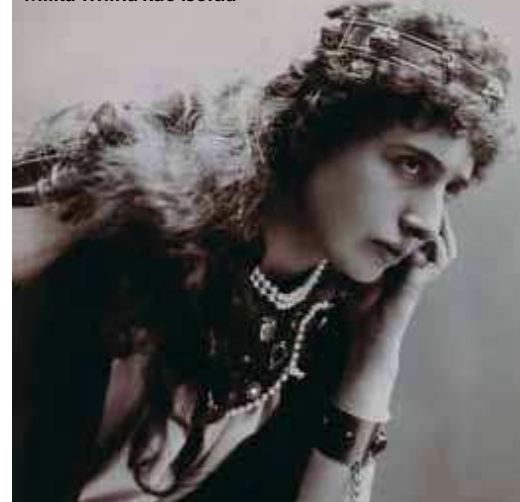
Proslavljena operna diva Milka Trnina kao Isolda

inca, na dan kad je Muzej i osnovan, otvorit će se izložba poliglotskoga naziva "100/STO/C/HUNDRED/CENTO/CENT...NAŠIH PRVIH STO...". Tom velikom retrospektivom, i tematski i prezentacijski vrlo kompleksnom, djelatnici Muzeja zaokružiti će slavljeničku zadaću – predstavljanje djelovanja MGZ-a tijekom (prvih) stotinu godina, osobito njegove uloge u stvaranju povijesnoga dijaloga i formiranja svijesti o identitetu grada i njegovih žitelja, s aspekta današnjega vremena i na način blizak današnjim naraštajima. Vremešni slavljениk dobit će i monografiju, i svoju web stranicu, tiskana je i promovirana prigodna poštanska marka i omotnica prvog dana, a o dosadašnjih stotinu godina plodnoga zajedništva sa svojim gradom, građanima i cijelom domovinom, snima se i prigodan dokumentarni film.