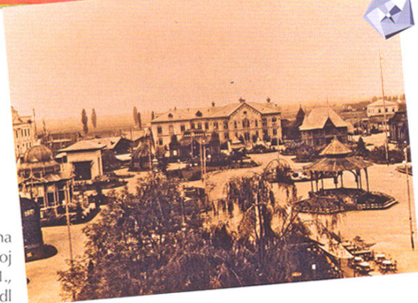
Paviljoni na Gospodarsko-šumarskoj izložbi u Zagrebu, 1891.

Da bi doživljaj prezentiranih sadržaja bio što potpuniji obogaćen je i odgovarajućom zvučnom kulisom, a u izložbenim dvoranama s temama iz 20. st. uključeni su i originalni audio, filmski i TV zapisi.