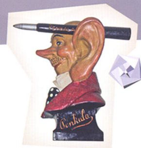
Reklamna glava „Penkala“