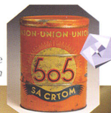
Kutija za bombone 505 sa crtom