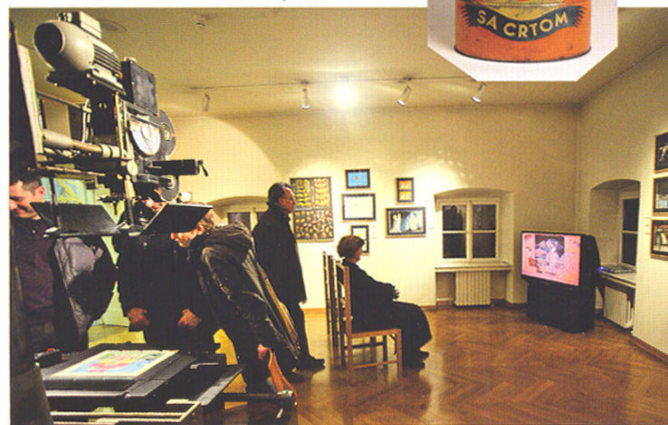
Zagrebačka škola crtanog filma u stalnom postavu