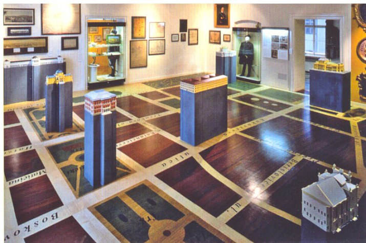
Donji grad, stalni postav