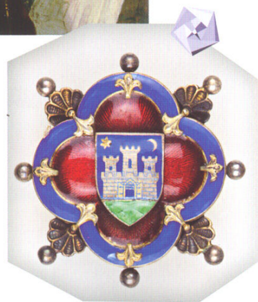
Počasni znak gradskog zastupnika, nacrt: Herman Bollé, zlatar: Slavoljub Bulvan, Zagreb, 1905.