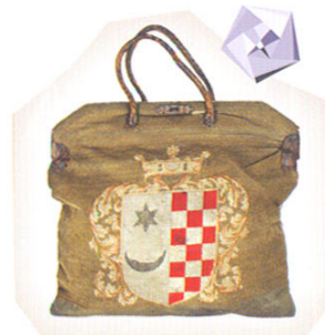
Putna torba Lj. Gaja

U pedesetim godinama 20. st. pojavljuje se Zagrebačka škola animiranog filma koja je Zagreb proslavila u cijelom svijetu. Godine 1962. redatelj i animator Zagrebačke škole Dušan Vukotić osvojio je nagradu Oscar za film Surogat , prvi Oscar za crtani film dodijeljen autoru izvan Amerike.