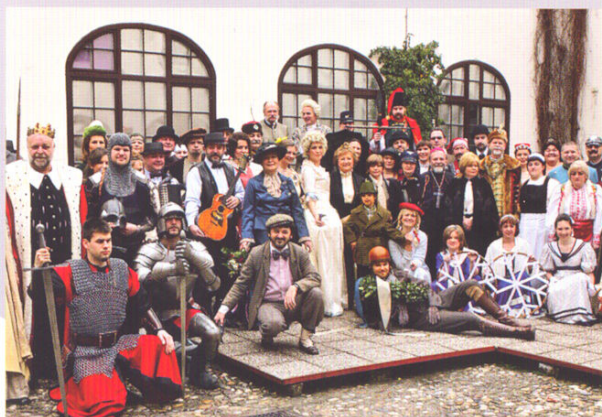
Oživljeni povijesni Zagrepčani na Živim slikama

U prvoj postavi Muzeja grada Zagreba bio je izložen model Gradeca prema stanju iz 1864. izrađen u sadri koji se od tada izlagao u svim stalnim postavima i postao najatraktivnijim muzejskim eksponatom.