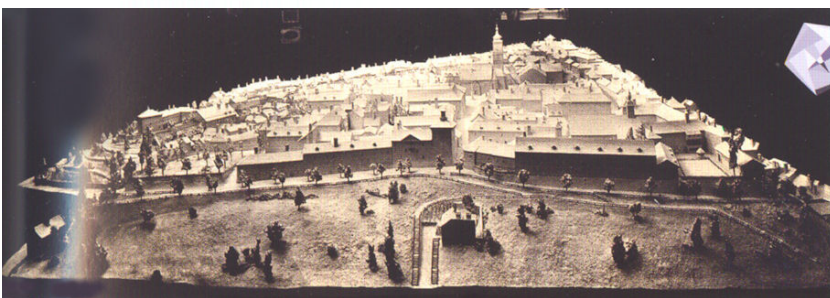
Maketa Gornjeg grada (stalni postav MGZ-a u Umjetničkom paviljonu), 1926.