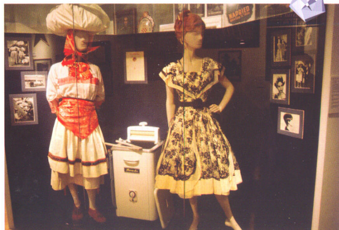
Šestinčanka i moda 1960-ih