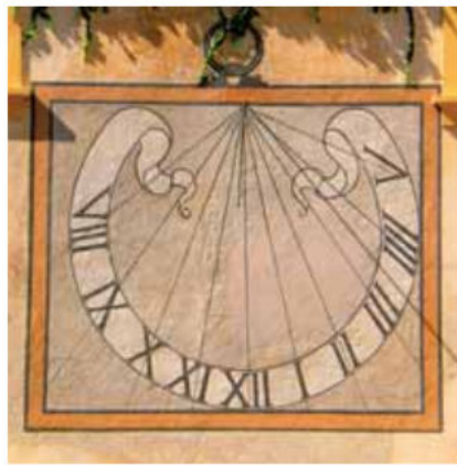
Sunčana ura - najstarija je sačuvana zidna ura u Zagrebu

Gotovo je potpuno sačuvano sjeverno samostansko dvorište s oslikanim proče-