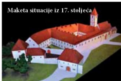
Maketa situacije iz 17. stoljeća

sao je 1637. Franji Thausiju, provincijalu ugarske franjevačke provincije Sv. Marije: "Često premišljam o stanju svoje biskupije i o njezinim nedostacima, te među ostalim dolazi i taj nedostatak da u cijeloj Kraljevini Slavoniji nemamo niti jednog zaklona, gdje bi se mogle časno zakloniti i živjeti djevojke iz naše domovine, koje svoje djevičanstvo posvećuju Kristu i koje žele zatvorene u kojem samostanu Njemu