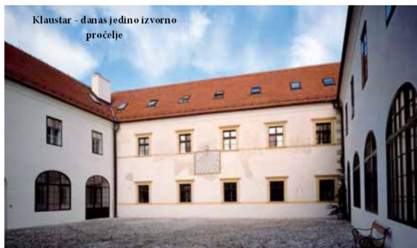
Klaustar - danas jedino izvorno pročelje

ljima, raščlanjenim stupovima, lukovima, zabatima i volutastim ukrasima uz prozore, zlatnožute i sive boje. Dvorište je obnovljeno prema konzervatorskim nalazima, 1993.