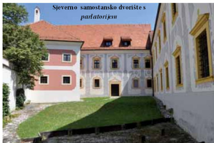
Sjeverno samostansko dvorište s parlatorijem

Samostan klarisa ukinuo je 1782. car Josip II. u jeku reformi, kad su dekretom nestali svi samostani "koji ne naučuju ili bolesnika ne dvore", kako je pisao Tadija Smičiklas. Dekret o raspuštanju samostana u Zagrebu izdan je 27. veljače 1782. Klarise su, uza skromnu otpremninu, napustile zgradu, ali se spominje da je još