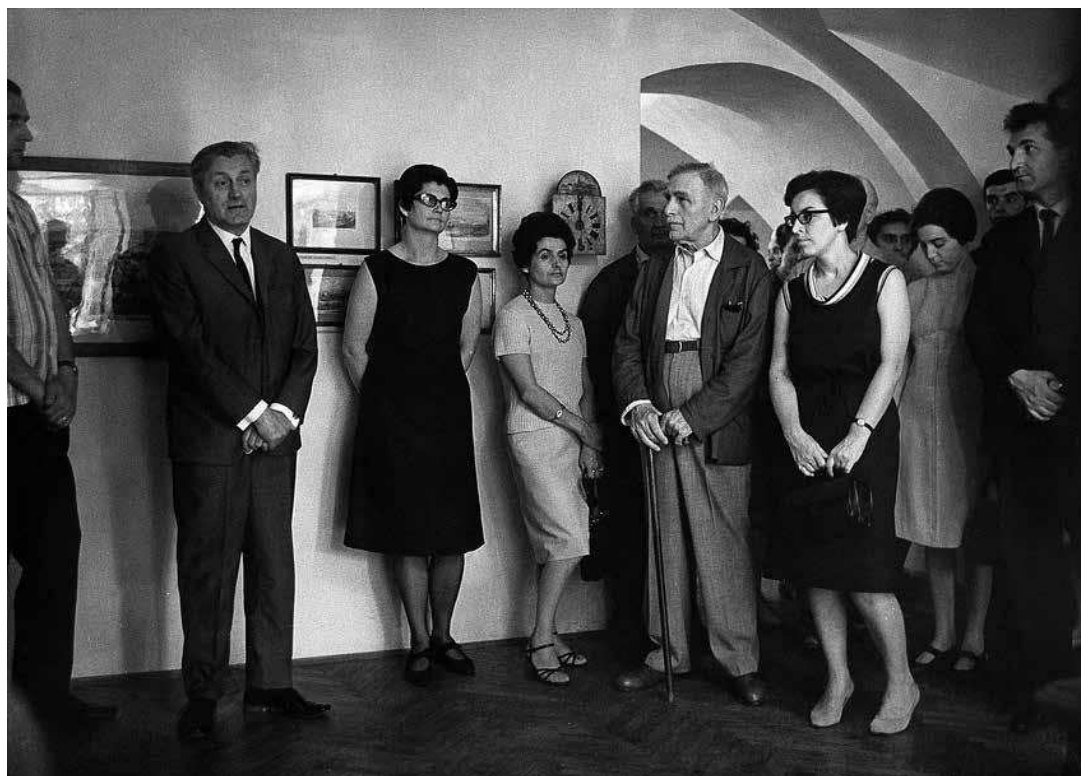
sl.9. Otvorenje izložbe "Slike Zagreba u 19. stoljeću"