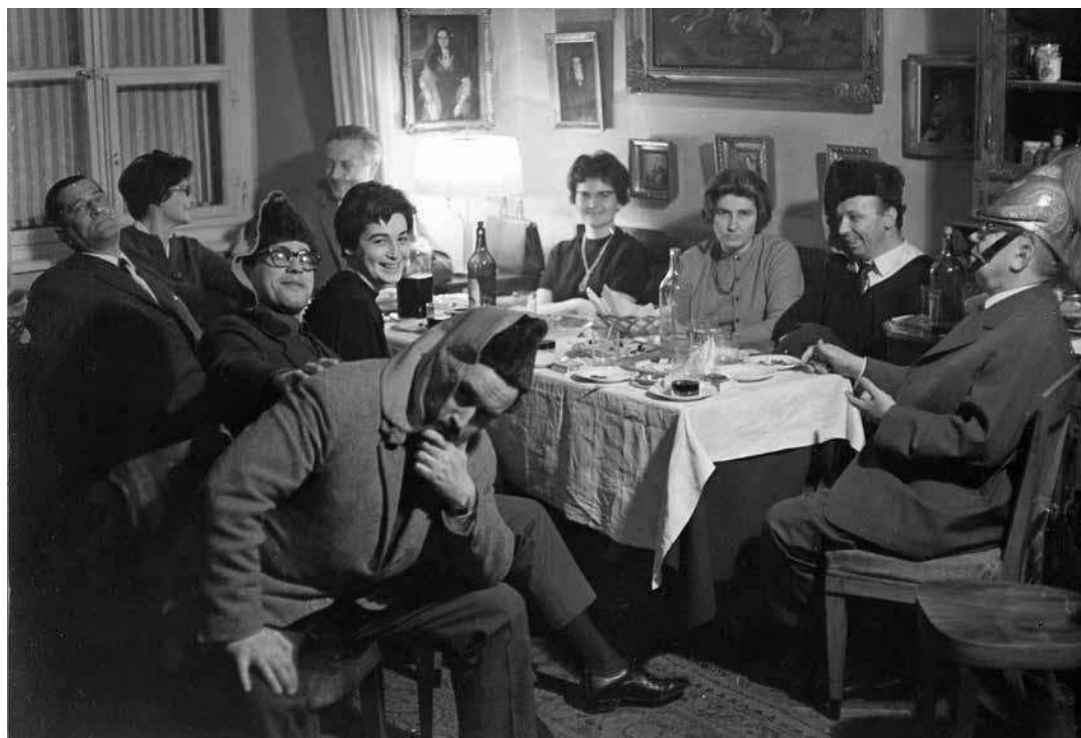
sl.12. Kostimirana zabava djelatnika Muzeja grada Zagreba.