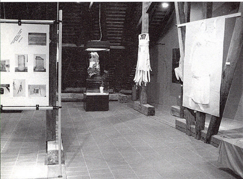
S IZLOŽBE NA KRAJU PROGRAMA U MUZEJU GRADA ZAGREBA lijevo