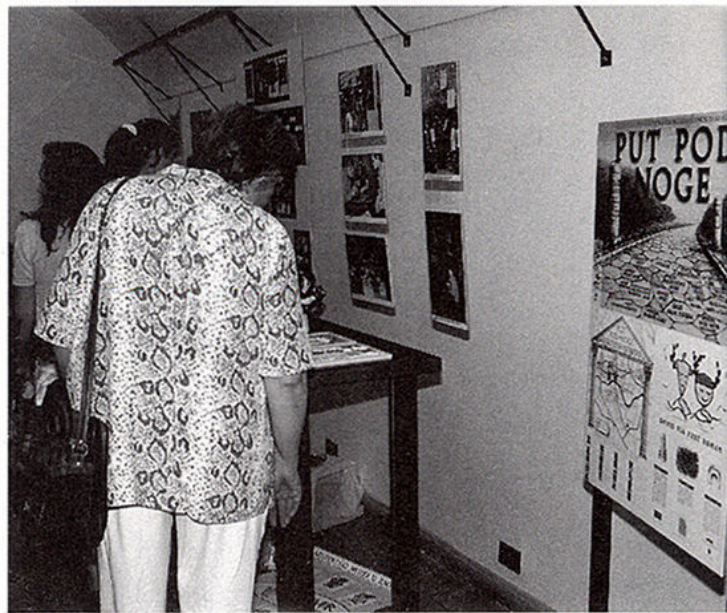
S IZLOŽBE U CASTEL SANT ANGELO gore