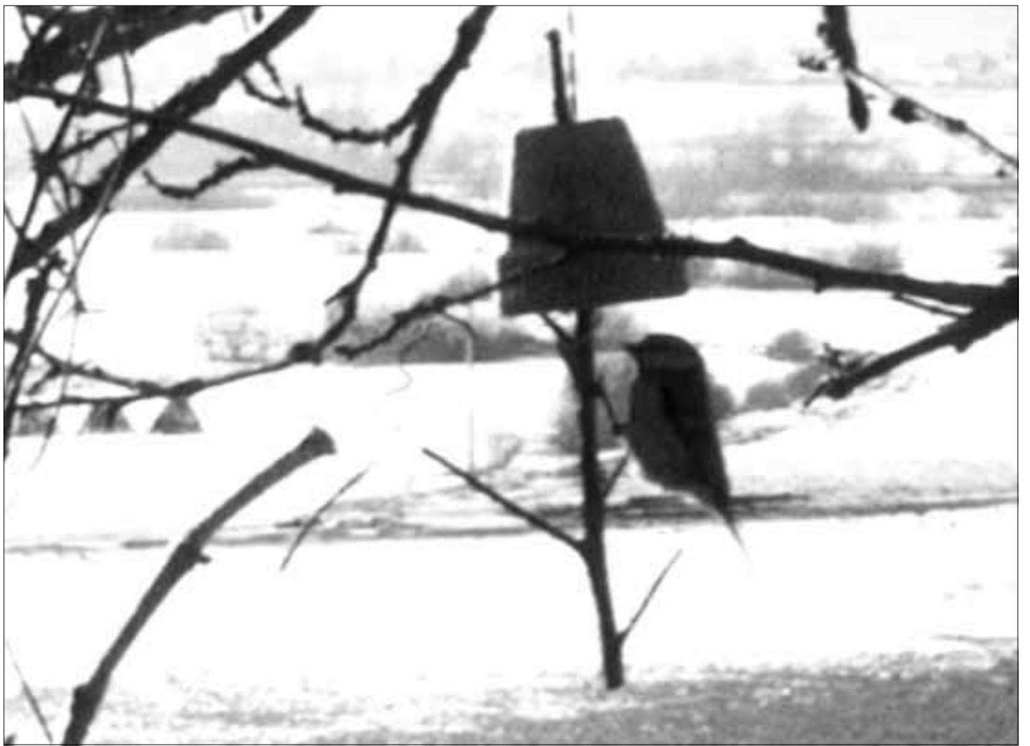
Monumentalnost sitnih bića: Čvorak na hranilici u Galetinu filmu »Endart«

Uz premijeru ekperimentalnog filma Ivana Ladislava Galeta »Endart« u kinu »Tuškanac« / Riječ je o djelu u nastanku koje će u svojoj konačnici sadržavati 18 dijelova / Temelj je rečenica romana »Uliks« koja je organizirana prstenasto bez jasnog početka i kraja