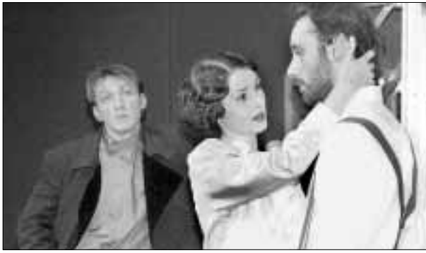
Nastup na »Sarajevskoj zimi«. »Ljubavna pisma Staljinu« Teatra ITD

ZAGREB, 27. veljače – Zagrebački Teatar ITD nastupio je u ponedjeljak na večer s predstavom »Ljubavna pisma Staljinu« Juana Matorgea, u režiji Saše Broz, na 17. međunarodnom festivalu »Sarajevska zima«. Nakon izvedbe u prepunoj velikoj dvorani sarajevskog Narodnog pozorišta Veleposlanstvo Republike Hrvatske u Sarajevu priredilo je prijam u čast Teatra ITD, na kojemu su bili mnogi uzvanci iz kulturnog, javnog i