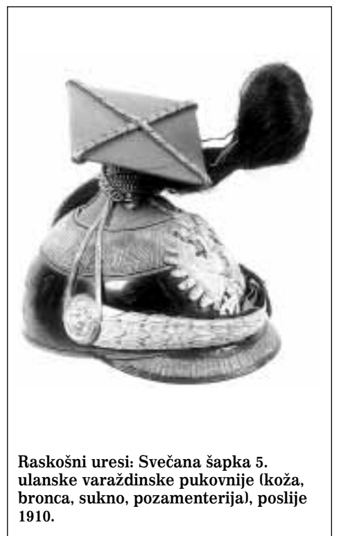
Raskošni ureši: Svečana šapka 5. ulanske varaždinske pukovnije (koža, bronca, sukno, pozamenterija), poslije 1910.