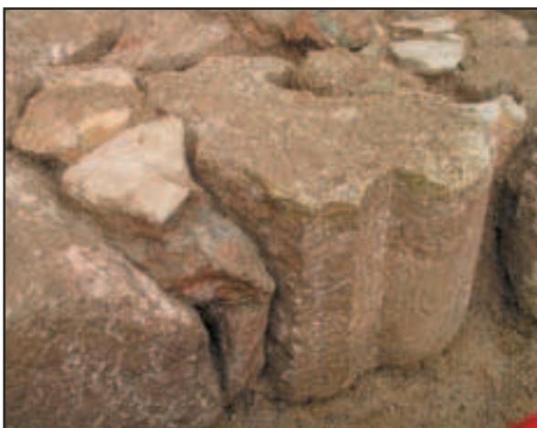
Ranogotički spolij u pronađenom temelju istočnog kontrafora

kamenja i spolija s ranogotičkim profilacijama te vezani vapnenom žbukom. Razvidno je, s obzirom na to da se temelji nalaze simetrično u odnosu na južni portal te se dijelom „podvlače“ pod temelj crkve, da je crkva u jednoj građevinskoj fazi imala više kontrafora nego što je dosad bilo poznato. Grobovi su bili ukopani u grobne rake bez evidentirane grobne arhitekture, orijentacije zapad-istok, s pokojnicima položenim na leđa te s rukama položenima na prsa ili uz tijelo. Oni nam potvrđuju kako je, u jednoj fazi, na današnjem prostoru Trga sv. Marka postojalo groblje. Malen broj nalaza u grobovima (dvije pojasne kopče i spona za odjeću) pri ovoj fazi istraživanja, ne pruža do-