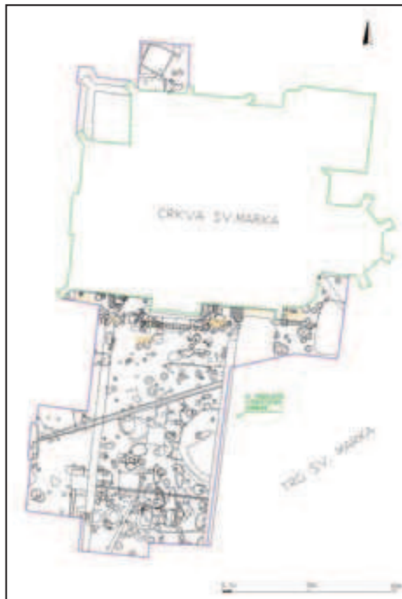
Trg sv. Marka, kompozitni tlocrt (izradila: A. Bugar)

Arheološki radovi bili su koncentrirani na dio trga uz crkvu koja se, kao župna crkva, prvi put spominje već u Zlatnoj buli Bele IV., 1242., a 1261. izuzeta je iz biskupske jurisdikcije te je predana na upravu gradskoj vlasti. Njezina