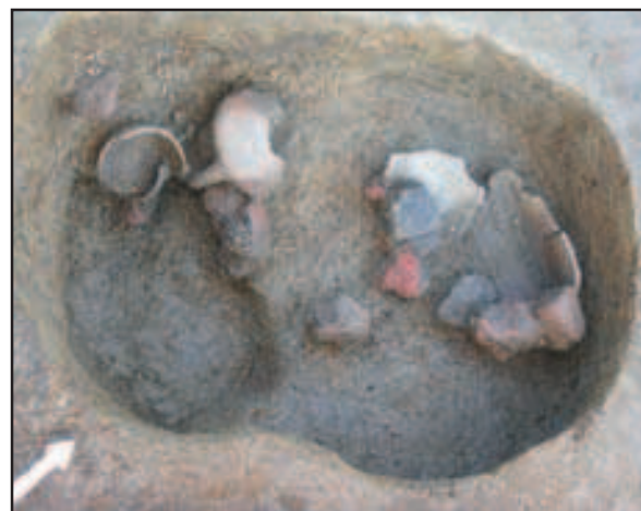
Jama 60 s ostacima keramičkih posuda i utega za tkalački stan, 8. – 6. st. pr. Kr.

Horvat 1992 Zorislav Horvat, Katalog gotičkih profilacija, Zagreb, 1992.