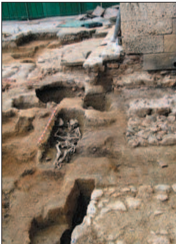
Grob 5, temelj pronađenoga istočnog kontrafora i južnog portala u odnosu na temelj crkve i novovjekne strukture

kamenja i spolija s ranogotičkim profilacijama te vezani vapnenom žbukom. Razvidno je, s obzirom na to da se temelji nalaze simetrično u odnosu na južni portal te se dijelom „podvlače“ pod temelj crkve, da je crkva u jednoj građevinskoj fazi imala više kontrafora nego što je dosad bilo poznato. Grobovi su bili ukopani u grobne rake bez evidentirane grobne arhitekture, orijentacije zapad-istok, s pokojnicima položenim na leđa te s rukama položenima na prsa ili uz tijelo. Oni nam potvrđuju kako je, u jednoj fazi, na današnjem prostoru Trga sv. Marka postojalo groblje. Malen broj nalaza u grobovima (dvije pojasne kopče i spona za odjeću) pri ovoj fazi istraživanja, ne pruža do-