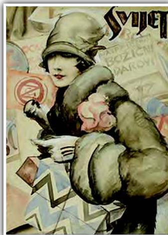
Jedna od naslovnica tjednika "Svijet"

Po završetku Prvog svjetskog rata, 1919. godine, likovni je autor alegorijskog lika mornara sa zastavom u definitivnom nizu maraka Državne pošte Hrvatske, i to nominalne vrijednosti 10, 20, 25 i 45 filira na tri ploče, pa tako razlikujemo iste marke po debljini papira i u nijansama boja. Osim područja Hrvatske, marke su u uporabi i na širem području Kraljevstva SHS (Slovenije i BiH).