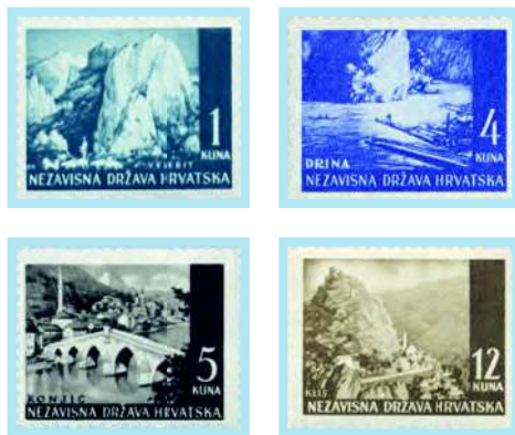
Krajobrazi - Velebit, Drina, Konjic i Klis

je jedan od vodećih “dizajnera” maraka NDH. Za Prvo redovno izdanje franke maraka NDH (1941. - 1943.) poznatijih kao “Krajobrazi” Otto Antonini daje likovna rješenja za petnaest od ukupno osamnaest maraka.