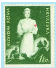
Medicinska sestra uz ranjenika

Doplatna marka u tjednu Crvenog križa (1942) bez nominalne vrijednosti prikazuje medicinsku sestru uz ranjenika.