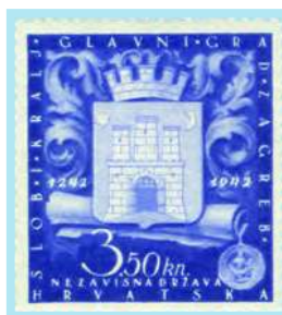
Grb grada Zagreba i smotana bula Bele IV.

U povodu proslave 700. obljetnice proglašenja Zagreba slobodnim kraljevskim gradom (1943) javlja se s veoma uspješnim rješenjem za prigodno izdanje.