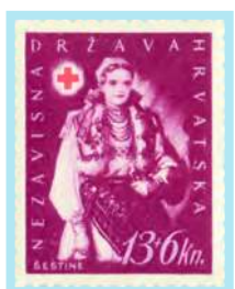
Ženske narodne nošnje Šestine, Slavonija, Bosna i Dalmacija

Doplatna marka u tjednu Crvenog križa (1942) bez nominalne vrijednosti prikazuje medicinsku sestru uz ranjenika.