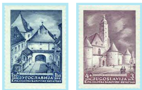
Kamenita vrata i stara zagrebačka katedrala

Povodom Druge filatelističke izložbe Hrvatskog filatelističkog saveza u Zagrebu (16. – 27. ožujka 1941.) izložene su dvije marke s doplatom u korist HFS-a, autora crteža Otta Antoninija i gravera Karla Seizingera, koje prikazuju Kamenita vrata i Staru katedralu u Zagrebu. Marke su trebale biti u prometu u Zagrebu i Slavonskom Brodu na dan 13. travnja 1941., te je sva naklada isporučena Zagrebu. Poštanska administracija NDH prihvaća cjelokupno izdanje druge države kao svoje, što je vjerovatno jedinstveni primjer u svijetu.