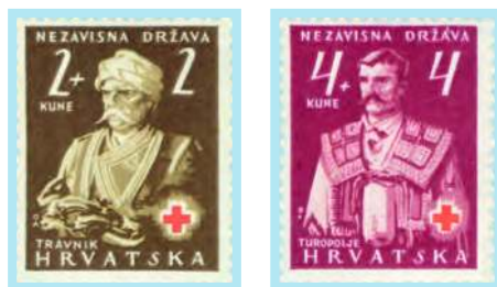
Muške narodne nošnje Sinj, Travnik i Turopolje