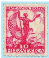
Alegorijski lik mornara sa zastavom

Povodom Druge filatelističke izložbe Hrvatskog filatelističkog saveza u Zagrebu (16. – 27. ožujka 1941.) izložene su dvije marke s doplatom u korist HFS-a, autora crteža Otta Antoninija i gravera Karla Seizingera, koje prikazuju Kamenita vrata i Staru katedralu u Zagrebu. Marke su trebale biti u prometu u Zagrebu i Slavonskom Brodu na dan 13. travnja 1941., te je sva naklada isporučena Zagrebu. Poštanska administracija NDH prihvaća cjelokupno izdanje druge države kao svoje, što je vjerovatno jedinstveni primjer u svijetu.