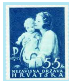
Izdanje u korist karitativne ustanova "Pomoć" (Slavoluk, trubljači i majka s djetetom)

U povodu proslave 700. obljetnice proglašenja Zagreba slobodnim kraljevskim gradom (1943) javlja se s veoma uspješnim rješenjem za prigodno izdanje.