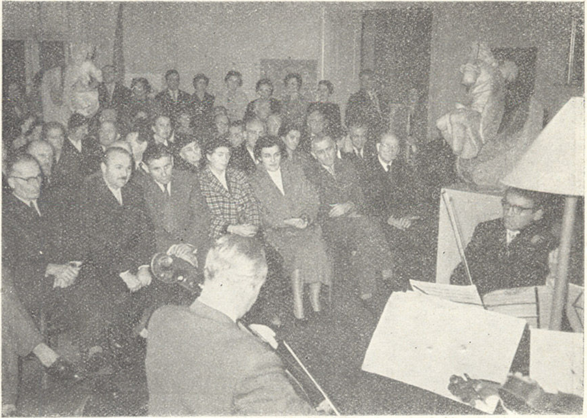
S proslave 50-godišnjice Muzeja grada Zagreba