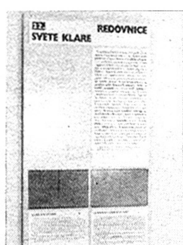
Pano s podacima o redu Klarisa