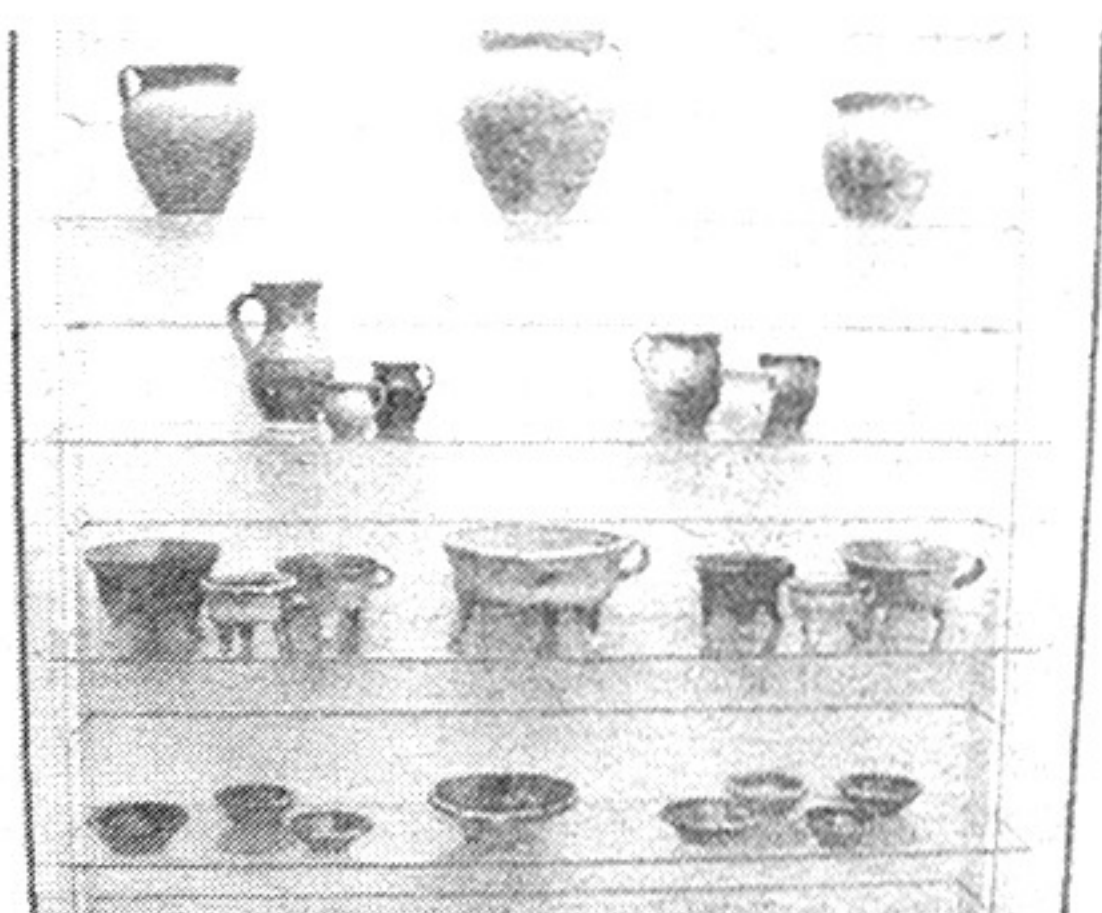
Keramičke posude nađene prilikom iskapanja

● Klarisama se, uz ostalo, pripisuje i zasluga osnivanja prve privatne ženske škole