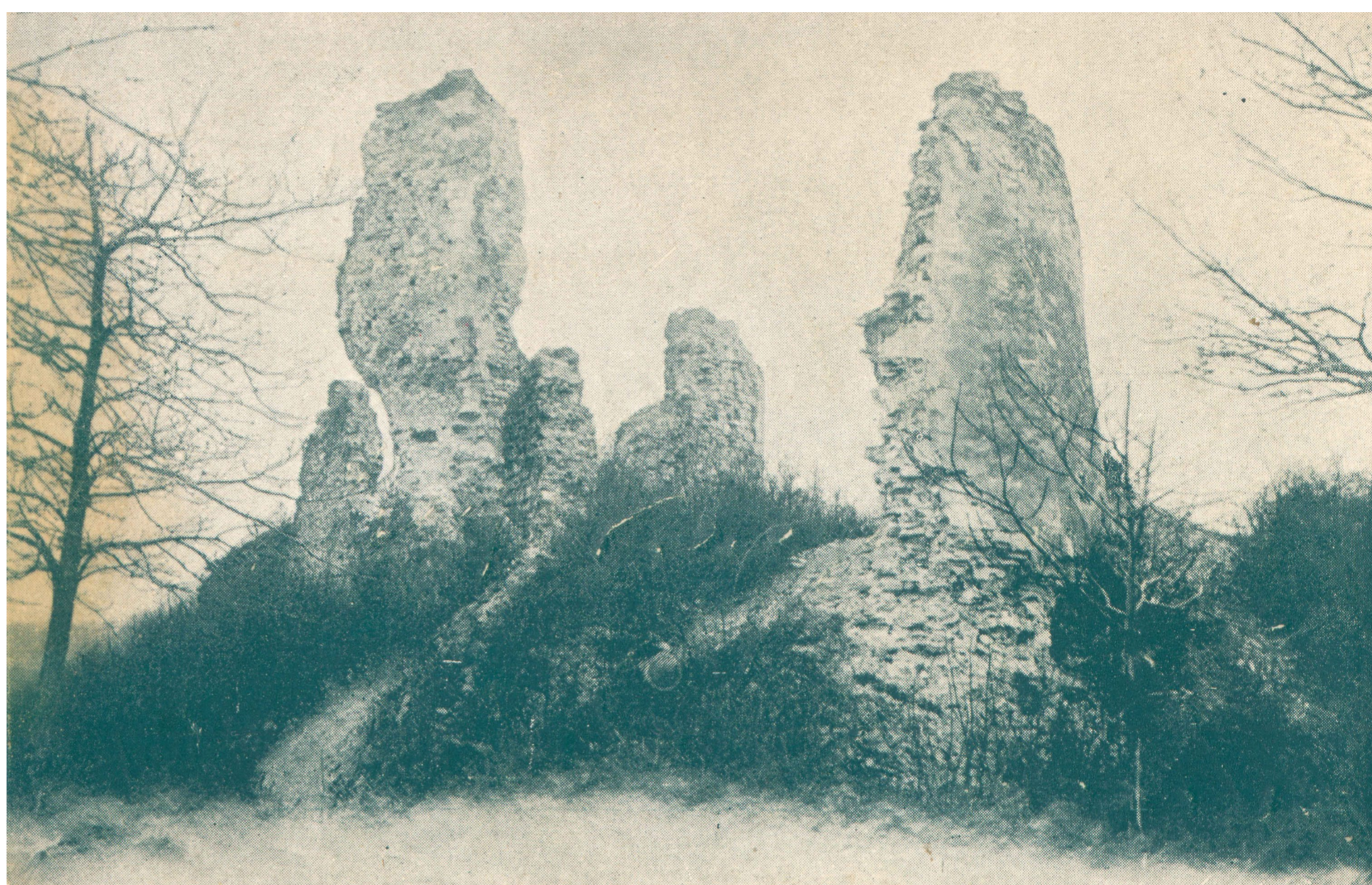
Ruševine Susedgrada Okolo 1924.