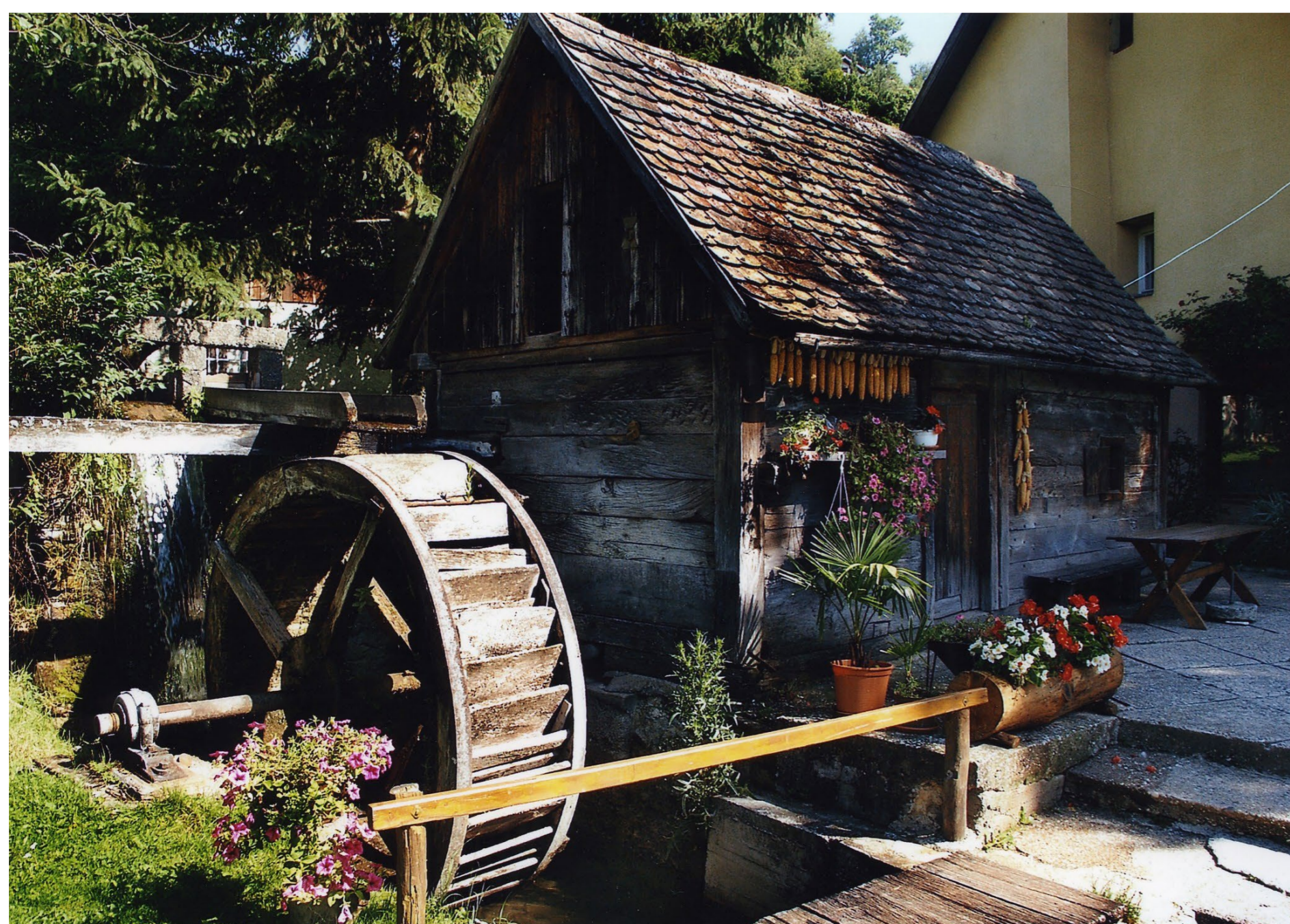
Gračanski ribnjak ili Banićev mlin Miljenko Gregl, 2004. / MGZ

Na sjevernoj strani Medvednice, u Donjoj Stubici, nalazi se obnovljeni Majsecov mlin, u kojem se ponovno melju zrna starih sorti kukuruza.