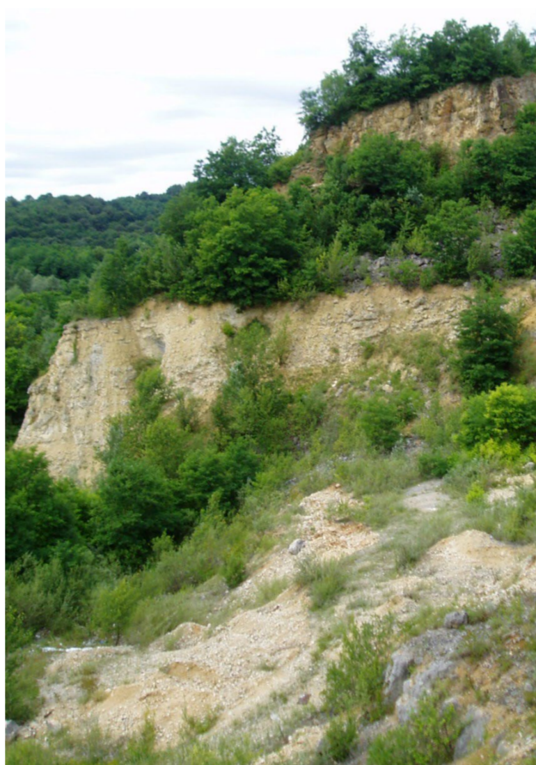
Zeleni škriljavac JU PP Medvednica