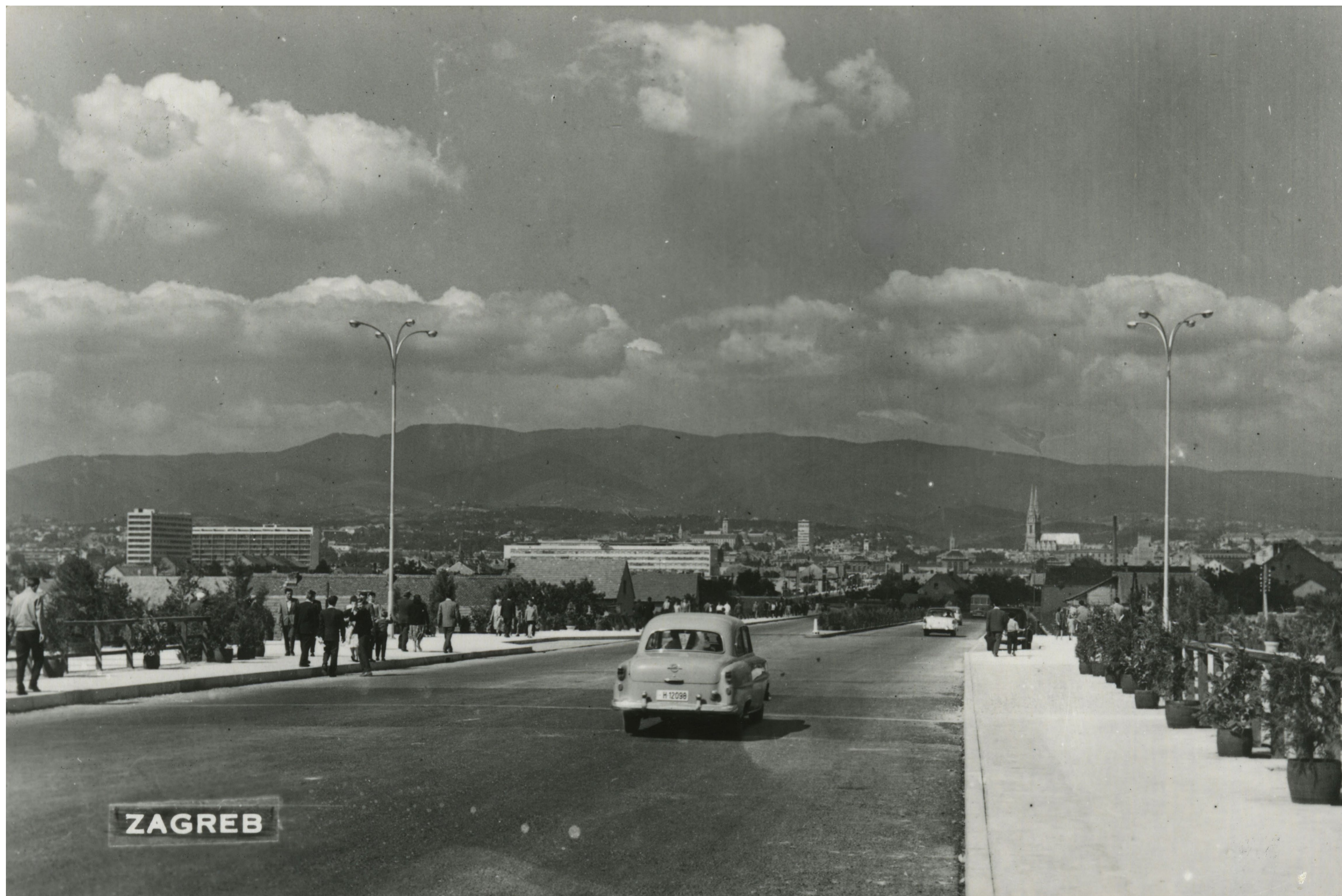
Pogled s Mosta slobode Druga pol. 20. st. / MGZ