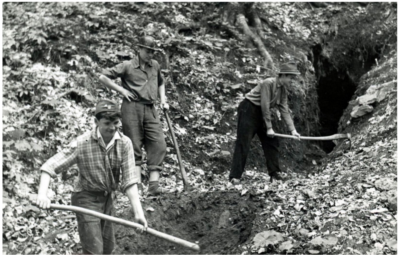
Radovi ispred okna drugoga Francuskog rudnika 1959.