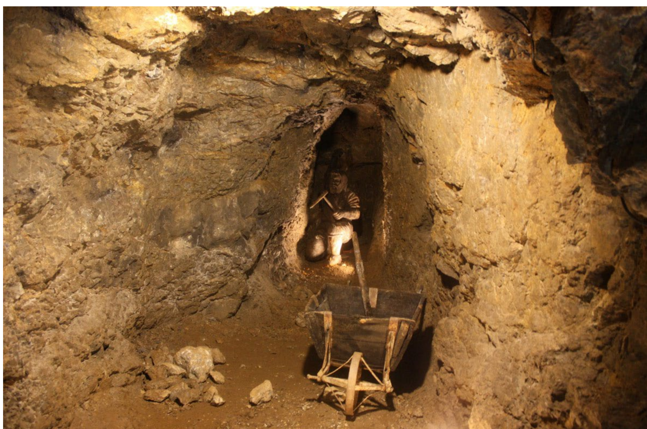
Rudnik Zrinski JU PP Medvednica

Rudnik Zrinski je zbog svoje vrijednosti 2006. godine proglašen zaštićenim kulturnim dobrom Republike Hrvatske. Kako bi se posjetiteljima što bolje dočarala srednjovjekovna rudarska svakodnevica, uređen je dio autentičnih rudničkih hodnika za turističko razgledavanje, pa svakako predložimo posjet rudniku.