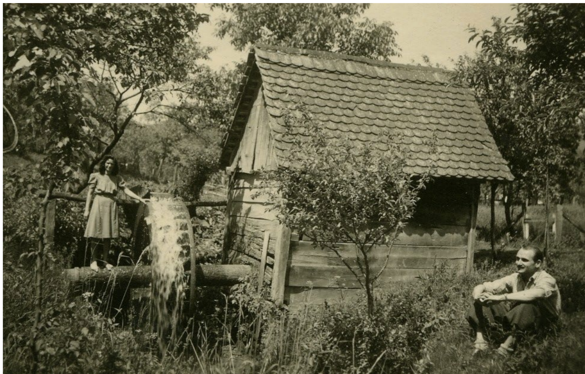
Mlin u Šestinama Foto Corso, 1943. / MGZ