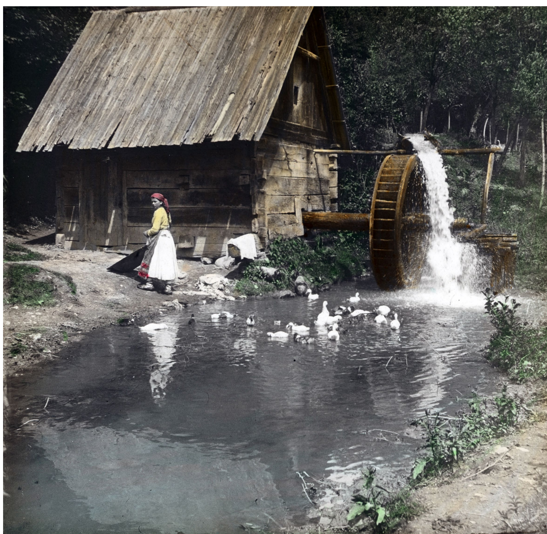
Mlin na Gornjem Vrapču Josip Kokalj, oko 1902. / MGZ