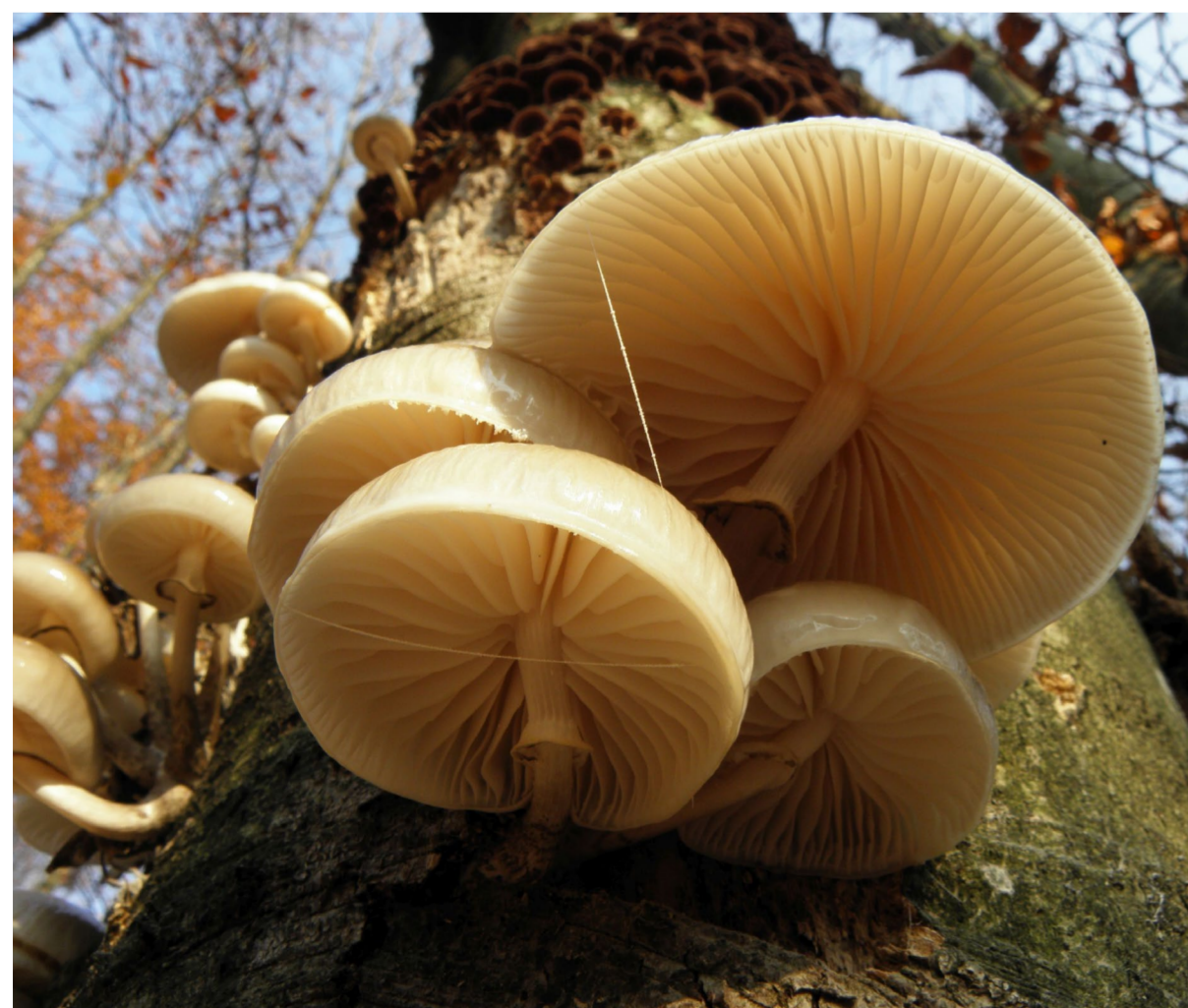
“Rasadnik” gljiva na drvetu Branko Balaško, 2011. / MGZ