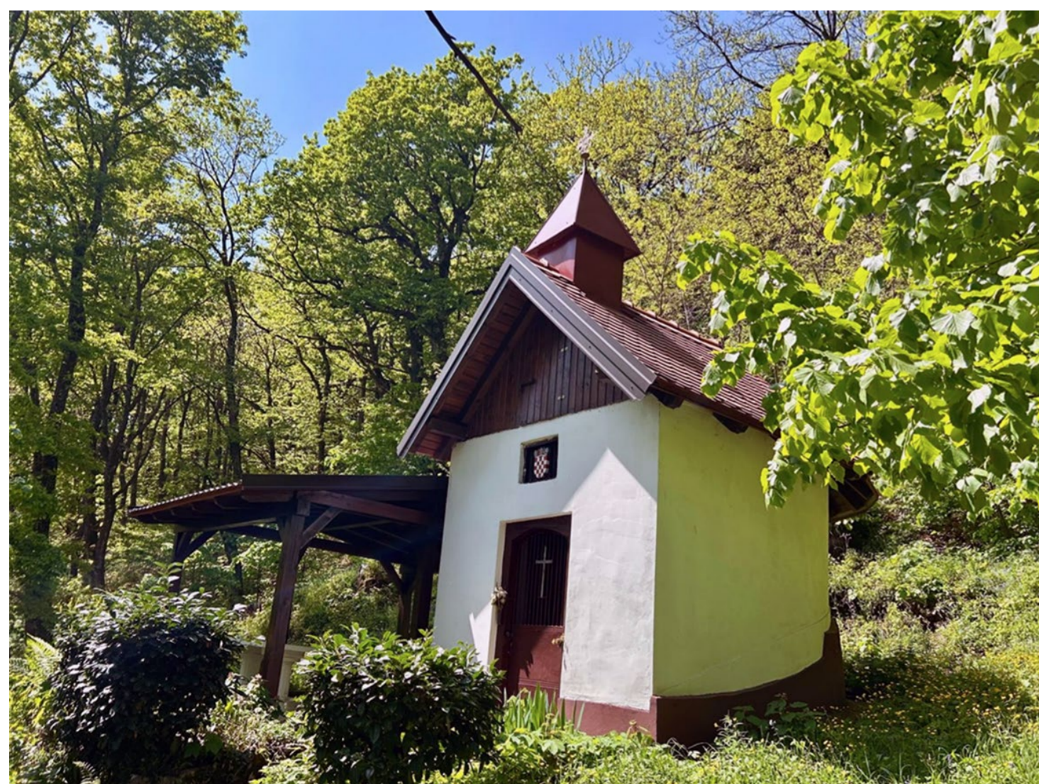
Kapela Marije Snježne