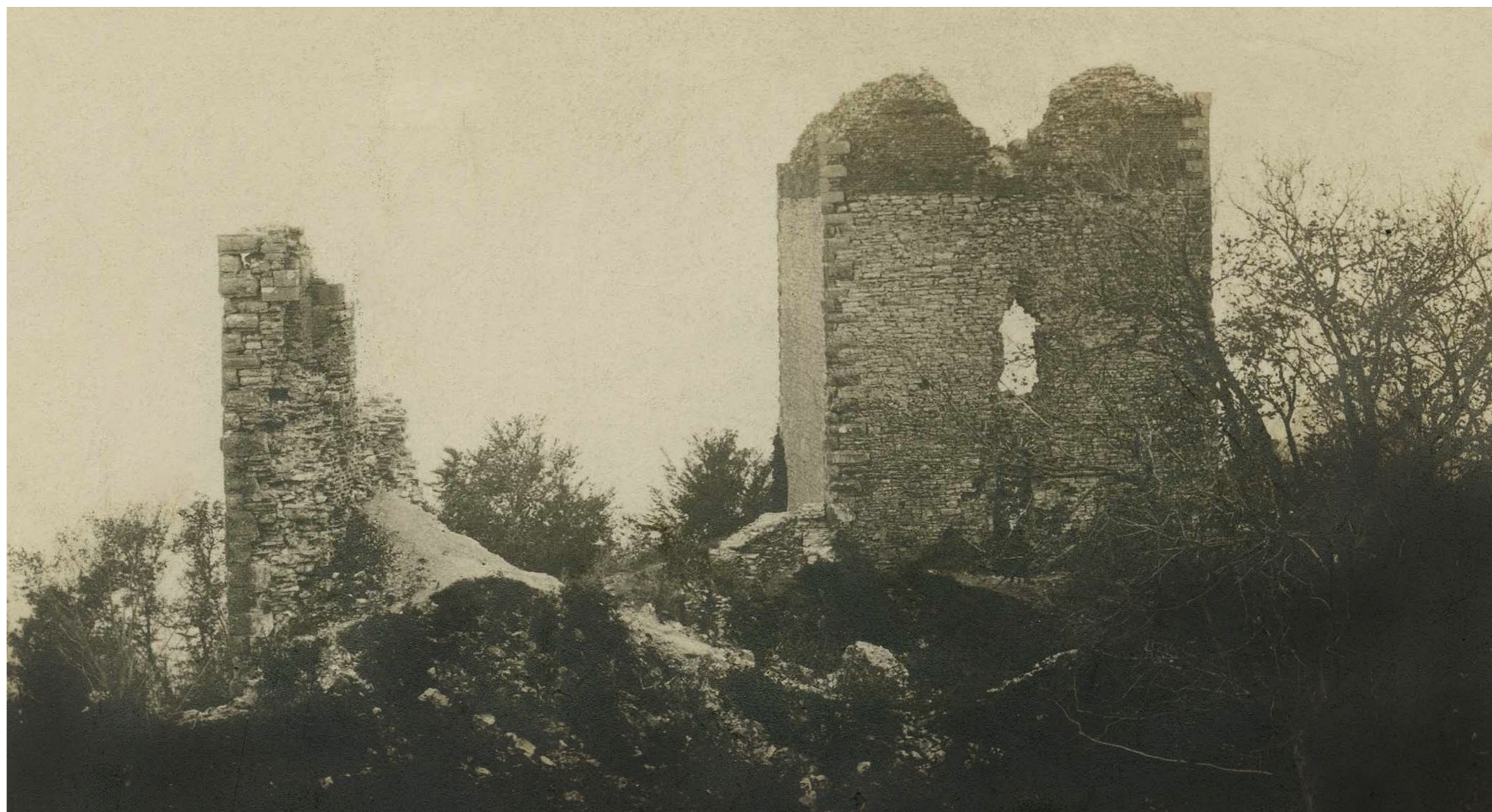
Ruševine Medvedgrada Oko 1925.

Predlažemo obilazak Centra za posjetitelje „Medvedgrad“. Do Medvedgrada možete doći planinarskom stazom 12.