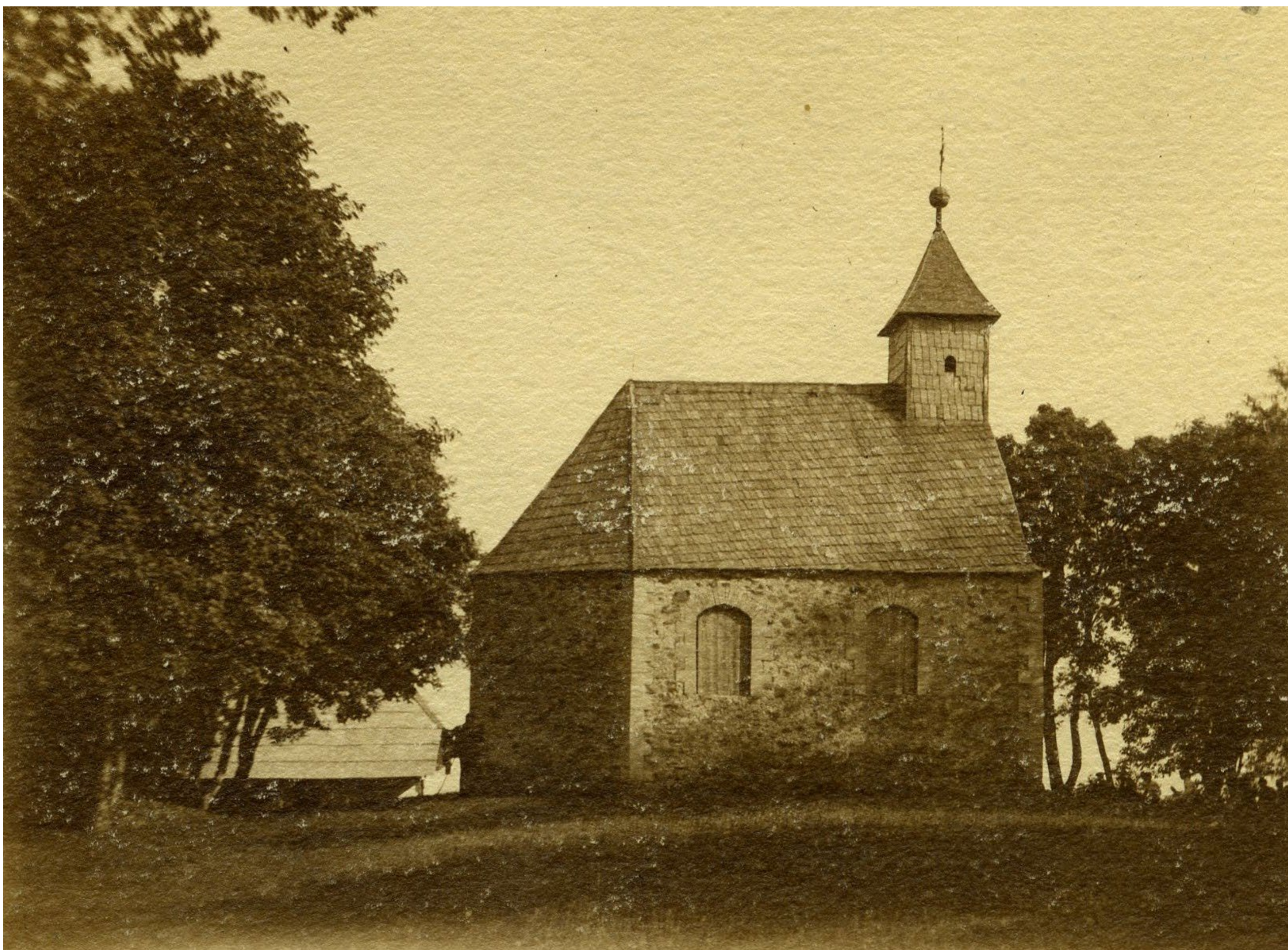
Kapela sv. Jakoba 1900.