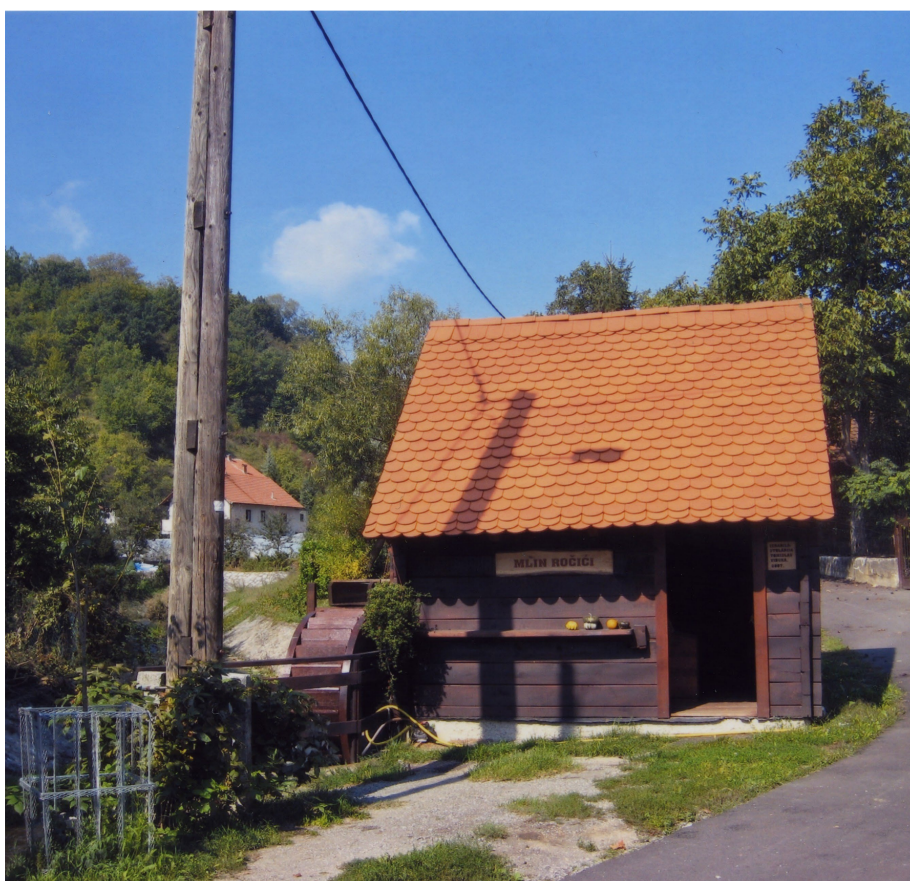
Mlin Ročić na Bidrovcu Radoslav Karleuša, 2009. / MGZ