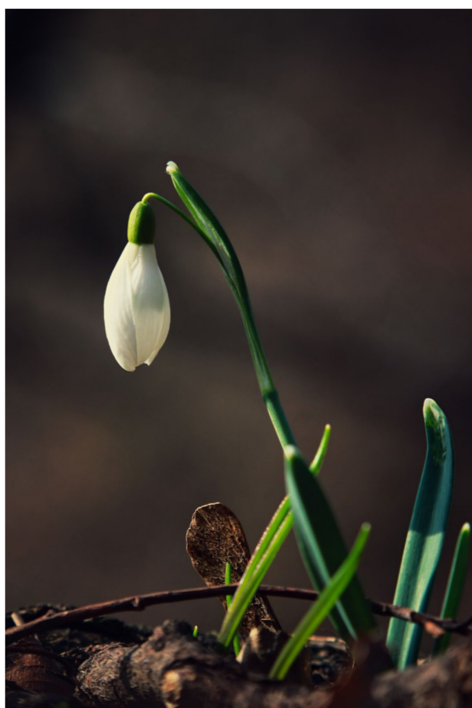
Visibaba s Kraljičina zdenca Tomislav Barkić, 2025. / MGZ