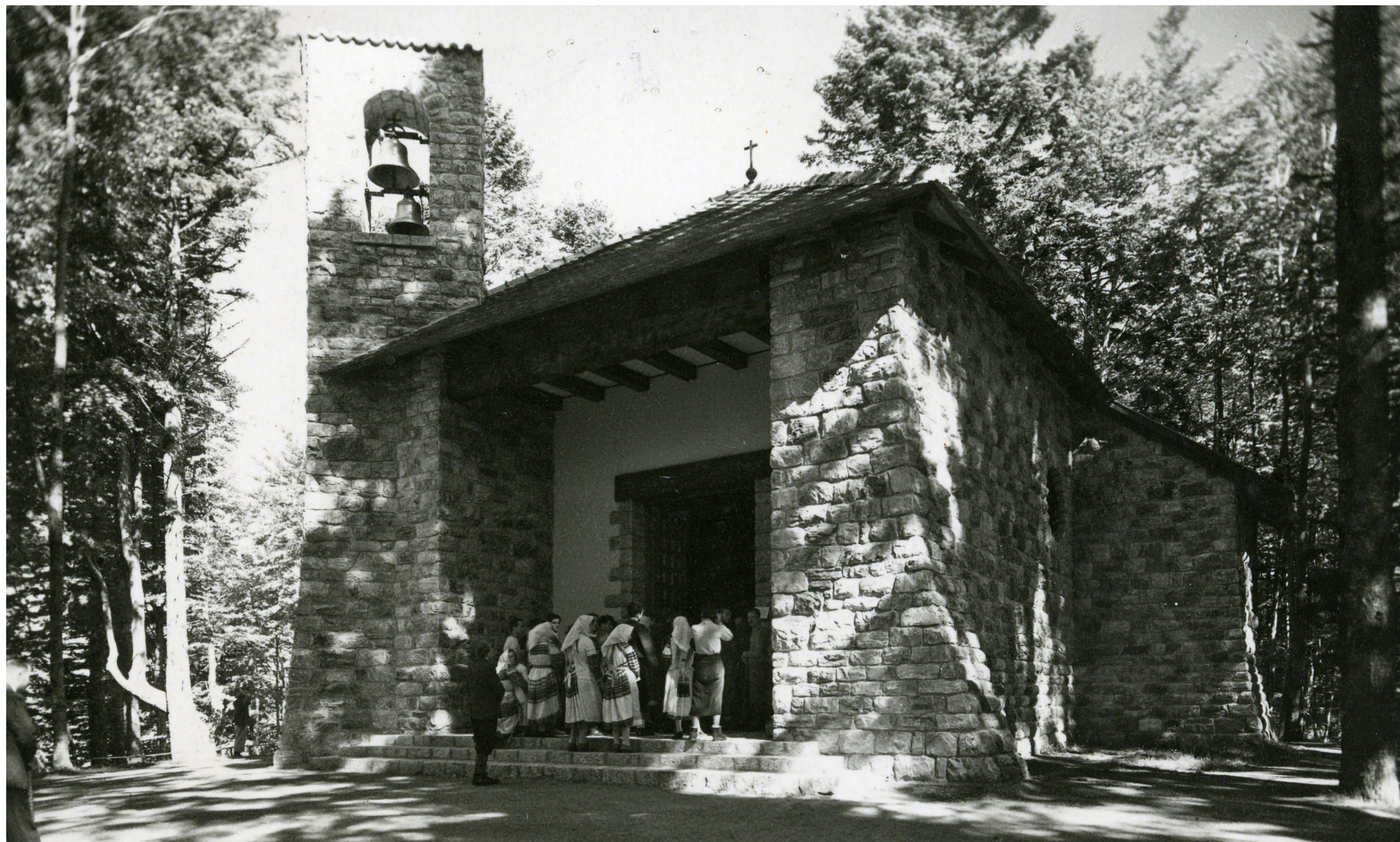
Kapela Majke Božje Sljemenske, Kraljice Hrvata 1932.