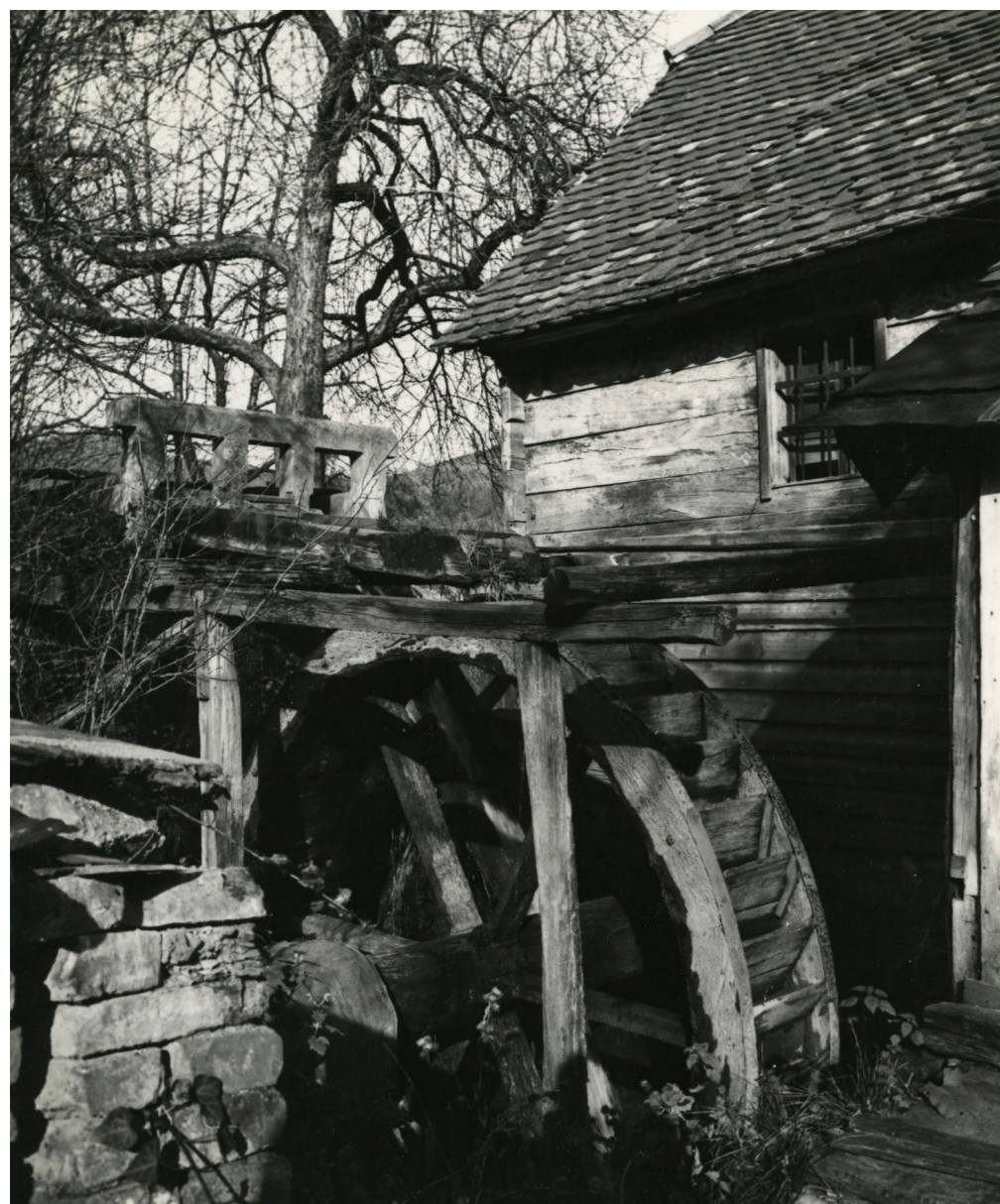
Mlin Gospodarić u Mlinovima Marijan Szabo, 1963. / MGZ