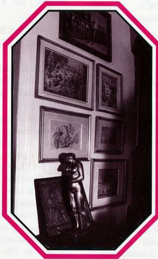
Detalj Zbirke Magjer, Tomislavov trg 8