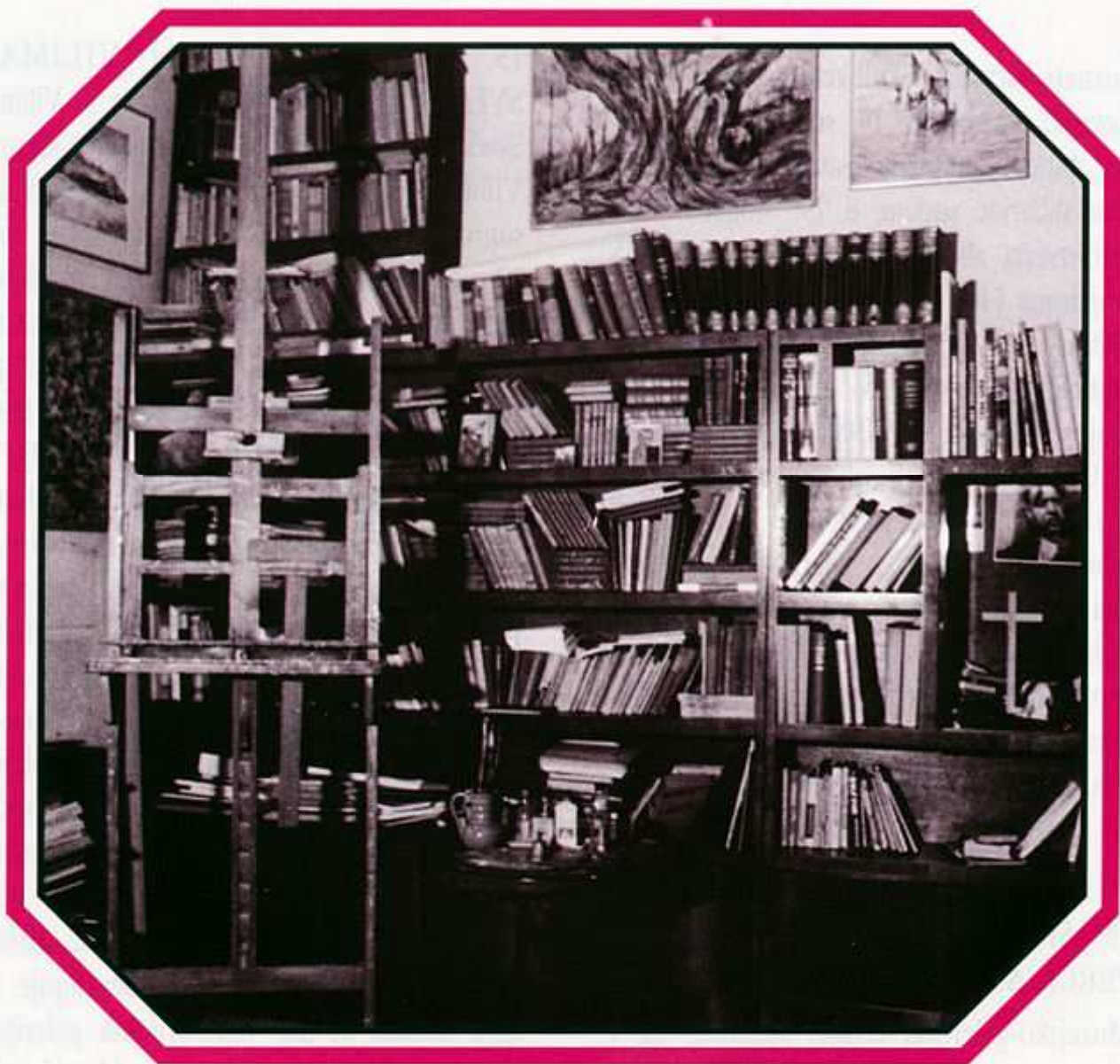
Zbirka Dr. Ivana Ribara

ambijenta stana na Krležinu Gvozd 23/ I, gdje su dugi niz godina živjeli Miroslav i Bela Krleža. 30 Zbirka trenutačno nije dostupna javnosti jer je, sukladno ugovornim obvezama Grada Zagreba, u tijeku