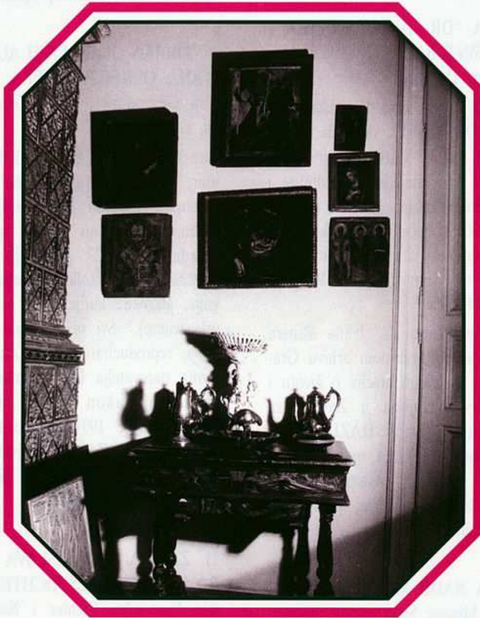
Detalj Zbirke Magjer, Tomislavov trg 8