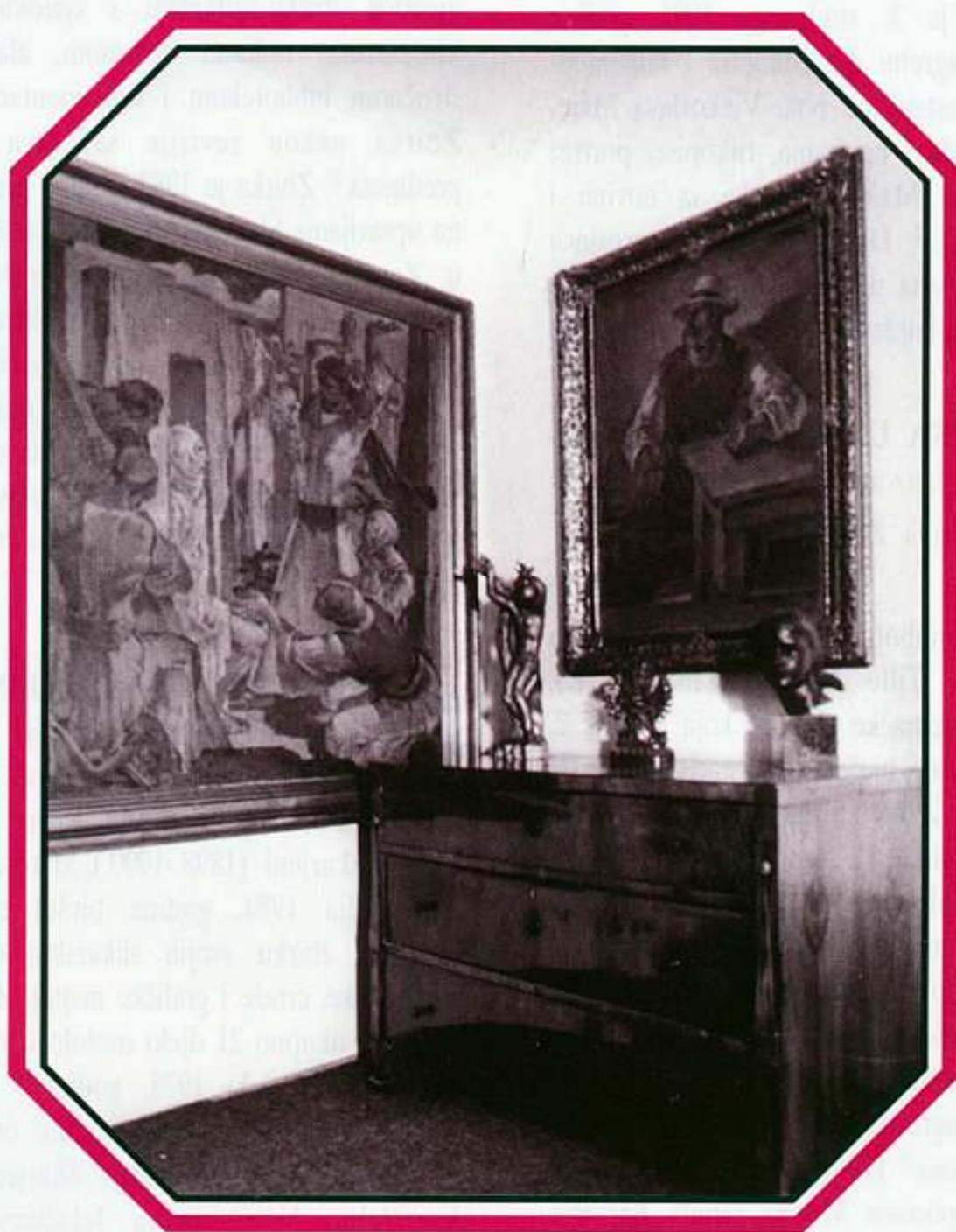
Zbirka Kljaković Magjer, Rokov perivoj 4.