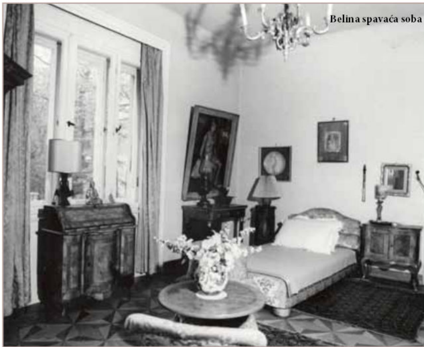
Belina spavaća soba