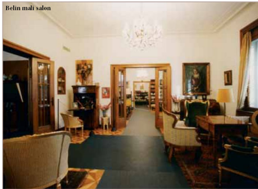
Belin mali salon

Belina spavaća soba. Pokraj malog salona nalazi se Belina spavaća soba. Bela i Krleža spavali su u zasebnim prostorijama i svakog jutra "ona će za njega glumiti novu ženu, ta umivena, očešljana, namerisana žena znati će da se divi, da zabavlja, da savjetuje, da oćarava svojom neposrednošću i uvijek da ostane pomalo ▶