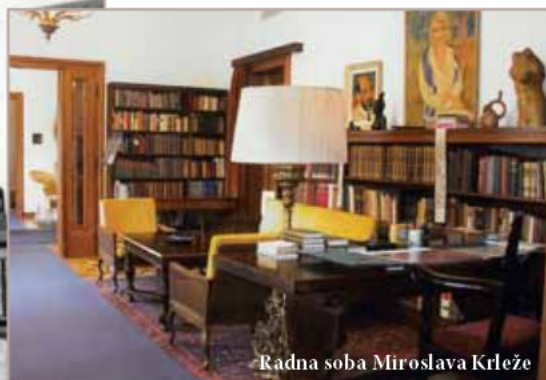
Radna soba Miroslava Krleža