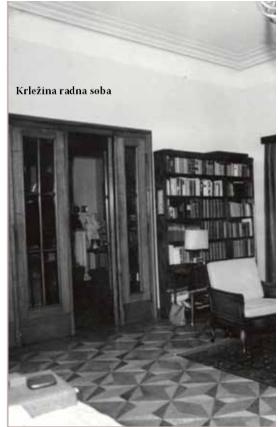
Krležina radna soba

► daleka, nedokučiva. Bela je bila žena koju je Krleža doživio u potpunosti i koja je kao takva postojala ". Smjer kretanja između njihovih soba paralelan je s pravcem kuće. Ovi prostori razlikuju se od svih ostalih, skladnom prisnošću i intimnošću. Supružnici u njima nalaze oazu mira. Na intimnom pak planu, ova suprotstavljena udaljenost pokazuje njihovu blisku emotivnu povezanost.