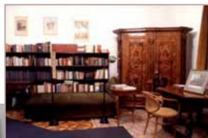
Krležina spavaća soba

Nasuprot vrata, neposredno pred policom s knjigama (gdje dominiraju Matoš, Gide, Baudelaire), skroman je francuski krevet s presvučenim uzglavljem. Na polici mali Philipsov radioapar, kupljen u Parizu 1952. Lijevo od kreveta neobarokni je stol s pločom izvijenih rubova (oko 1870.), a desno u uglu veliki orahov, furniran i intarzirani dvokrilni ormar s odrezanim uglovima, čija su vrata bogato intarzirana biljnim ornamentima. Tu je, dakaiko, pred prozorom i priručni radni stol na četiri balustarske noge, bogato intarzirani biljnim ornamentima (na ploči su intarzirani godina 1767. i Kristov monogram IHS) te manji stolić za dnevni domaći i strani tisak. I ovdje je najveći dio stilskog namještaja naslijede tete Pepe iz 1922. Desno, iza vrata dvokrilni je ormar, flankiran crnim pilastrima iz 1850., a lijevo mali stolić s pločom za pisanje u krevetu i metalnim stalkom (svjedok neprospavanih Krležinih noći). Uz peć, do vrata kupaonice bidermajerska je komoda od orahovine iz 1850., a nad njom reprint karte putovanja Cristobala Colona (Kristofora Kolumba) iz 1492., kupljen u Parizu.