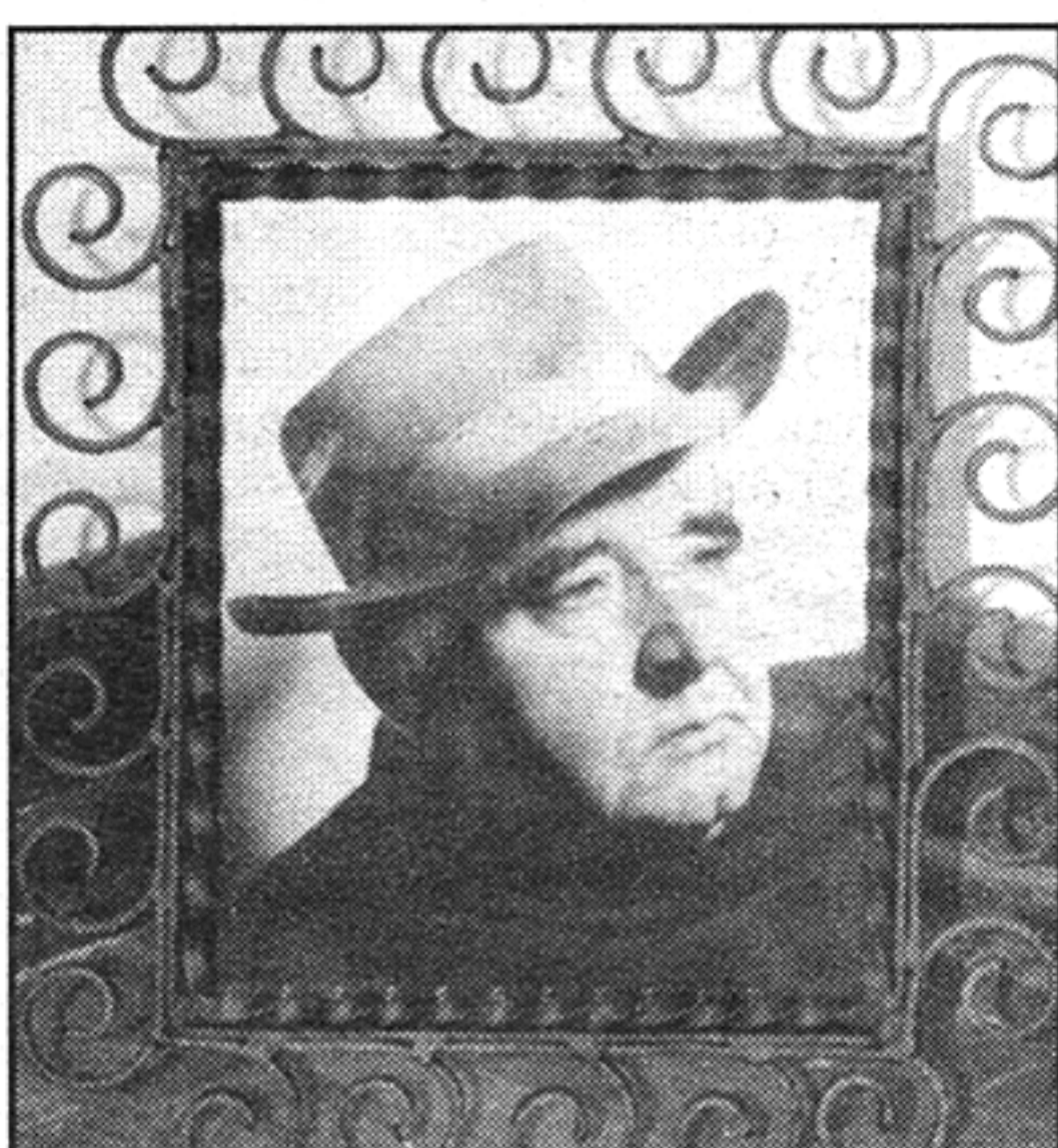
Miroslav Krleža sa svojim prepoznatljivim šešikom

grafi i sačuvani kazališni tekstovi. Bela je također u uspomenu imala odlikovanja, priznanja i plakete.