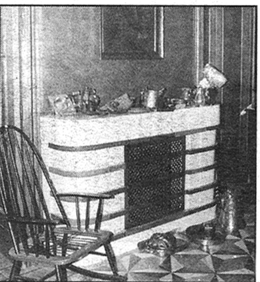
Kamin i stolac za ljuhanje u dnevnoj sobi

Među predmetima Krležine privatnosti su i pisma poznatih ljudi, Tita,