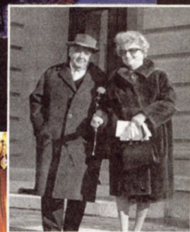
Miroslav i Bela Krleža