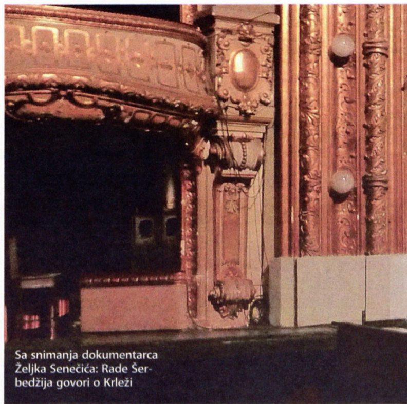
Sa snimanja dokumentarca Željka Senečića: Rade Šerbedžija govori o Krleži