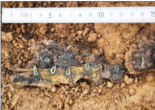
Dvodijelne dvopetljaste kopče