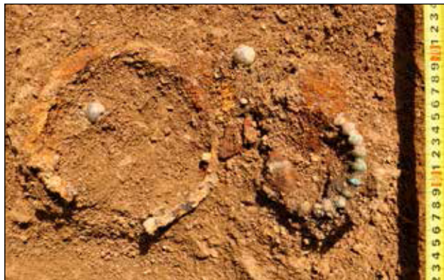
Brončano-željezna čvorasta fibula, željezna ogrlica i dvije staklene perle iz tumula 68