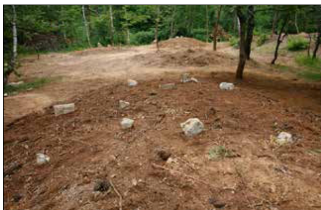
Nakon iskopavanja kamene ploče kojima su označavani grobovi vraćene su na mjesta ukopa.

izbora ukopnog mjesta nisu pravili razliku između ravnog terena ili tumula, nego su redom ukopavali u zemlju, bez obzira na konfiguraciju terena. Analiza svih priloga iz tih grobova i njihova komparacija omogućit će konkretniji uvid o vremenu ukopa, no i sada se može pretpostaviti vrijeme kada je započelo ukopavanje. Na području sela Budinjaka poznata su tri novovjeka groblja. Prvo, suvremeno, nalazi se tristotinjak metara istočno od crkve sv. Petke iznad Budinjačkog polja. Na tome mjestu ukapanja su započela sredinom 19. st. Drugo je bilo smješteno na istočnom rubu halštatske nekropole, pravokutnog oblika, ograđeno ogradom i jarcima. To je groblje prestalo biti u funkciji najvjerojatnije kada su započeli ukopi na spomenutom suvremenom groblju.