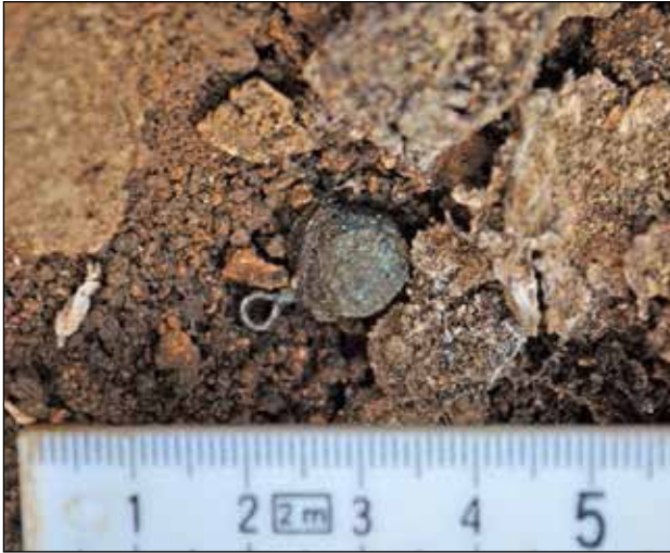
Gumb – privjesak s ušicom za ovjes