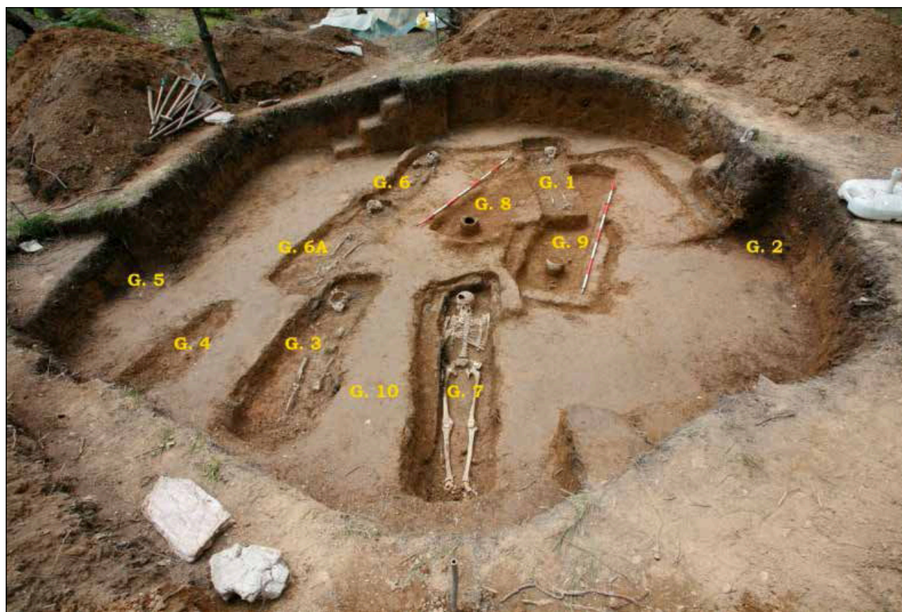
Primjer halštatskih i novovjekih ukopa u tumulu 67; grobovi br. 1 – 7 novovjekni, a br. 8 – 10 halštatski

Tijekom 2011. ukupna istražena površina iznosila je neto 356 m 2 . Istraženo je ukupno pet tumula: T. 67, T. 68, T. 70, T. 71 i oštećeni T. 69. Unutar nekropole grobnih humaka ta grupa tumula smještena je u istočnom dijelu nekropole, sjeverno od puta koji kroz budinjačko polje povezuje sela Budinjak i Bratelji.