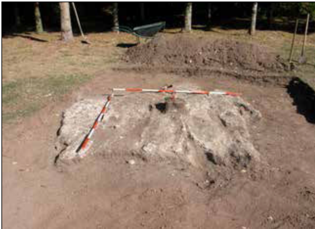
Pravokutna struktura od žbuke u sjeveroistočnom dijelu iskopa

iskopa, za sada je nemoguće ustanoviti radi li se o ostacima nedovršene kapele koju je krajem 19. st. započeo graditi tadašnji grkokatolički župnik ili o nekome drugom graditeljskom objektu.