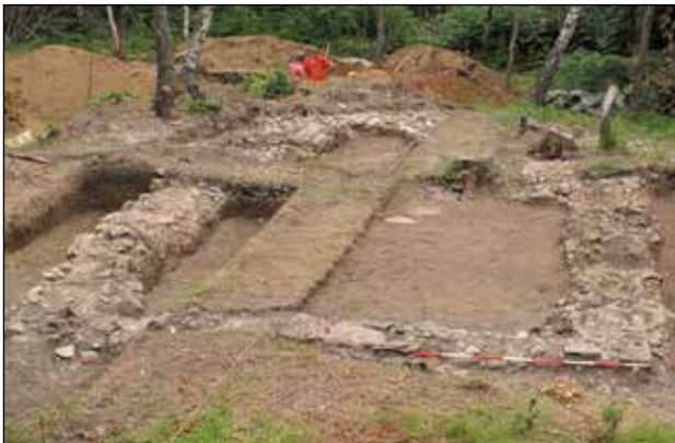
Crkva sv. Nedjelje

Tijekom istraživanja tumula bilo je dosta problema uzrokovanih korijenjem, koje je uvelike usporavalo iskopavanje i dodatno oštetilo grobove s nalazima. No, ove godine u tumulima su otkriveni nalazi koji nisu očekivani, barem ne u tolikom broju. Započevši istraživanje manjih tumula istočno od velikog oštećenoga grobnog humka 69, koji je zabilježen još 1986. prilikom geodetskog snimanja nekropole, pronađeni su brojni novovjekovni grobovi ukopani u