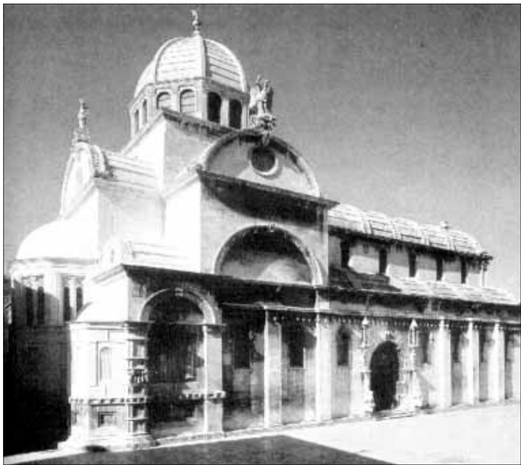
Remek djelo graditeljstva upisano na Svjetsku listu kulturne baštine UNESCO: Šibenska katedrala