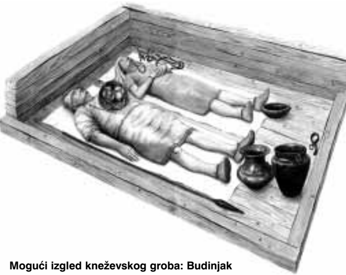
Moguć izgled kneževskog groba: Budinjak