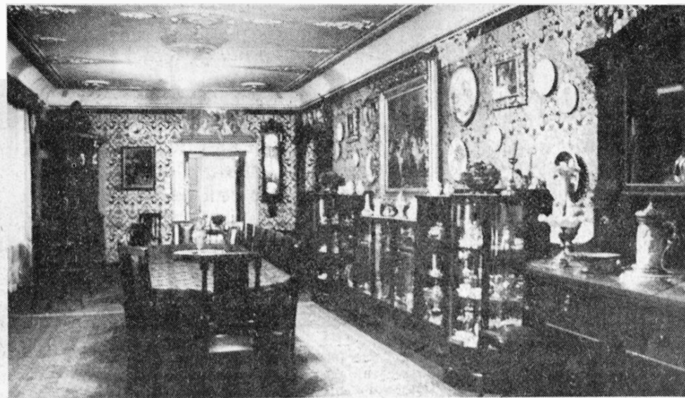
Jedna od bogato uređenih soba ambijentalnog muzeja u Visokoj 8 koju je obitelj Gvozdanović poklonila Zagrebu

Samo dvije kuće dalje, u Demetrovoj 7 na Gornjem gradu smještena je najzvučnija i naveličana zbirka koju je Zagrebu 1977. godine poklonio Ivan Gerersdorfer. Poznati zagrebački urar sabrao je 30-godišnjim radom po stručnim i znančkim kriterijima zbirku glazbenih automata koji su po svojoj raznolikosti i vrijed-