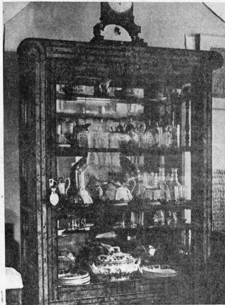
Vitrina s posuđem i staklom koje je s ostalim vrijednim predmetima grada poklonila Ljuba Penić. Sve je to sada pohranjeno u Muzeju za umjetnost i obrt dok se ne nađe »staratelj« za zbirku