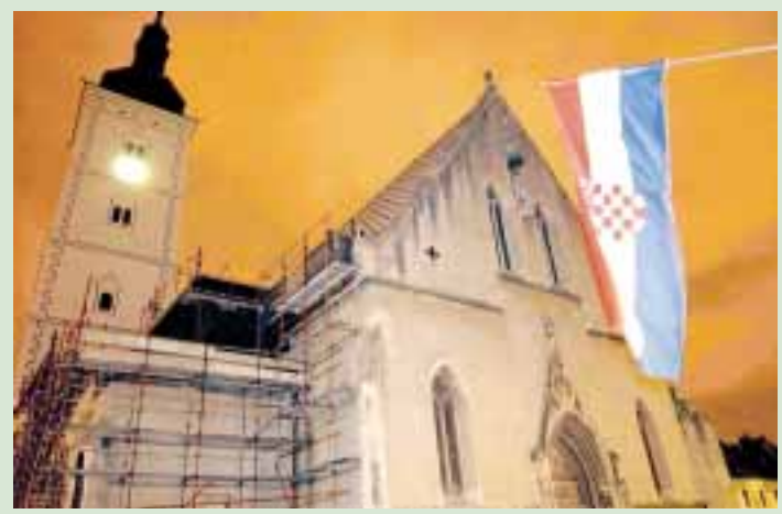
SKELE VEĆ PUNIH DVANAEST GODINA: Crkva sv. Marka

Skandal s kulturnim požeškim spomenikom kulture Kužnim pilom eksplodirao je početkom godine. Već 10 godina stručnjaci Hrvatskog restauratorskog zavoda tvrde da se spomenik ne može restaurirati, nego da se može ili konzervirati ili replicirati, iako se dotični zovu Restauratorski zavod, a ne Replikatorski ili Konzervatorski zavod. Tvrdi se da spomenik nije vlasništvo grada i građana, nego države. Što će odlučiti Vijeće Ministarstva kulture?