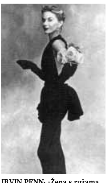
IRVIN PENN: »Žena sa ružama oko ruke« iz 1950.