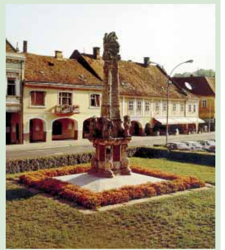
ZABORAVLJENOM SPOMENIKU PRIJETI PROPAST: Kužni pil u Požezi