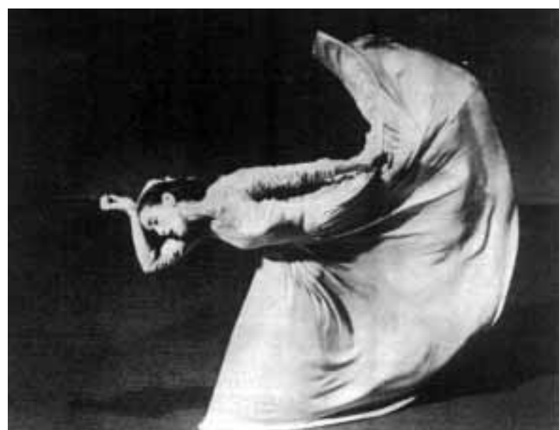
»Marta Graham«, 1979.