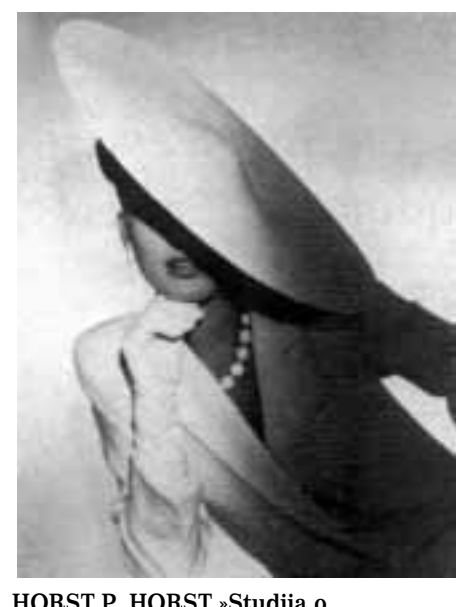
HORST P. HORST »Studija o slonovači« iz 1987.