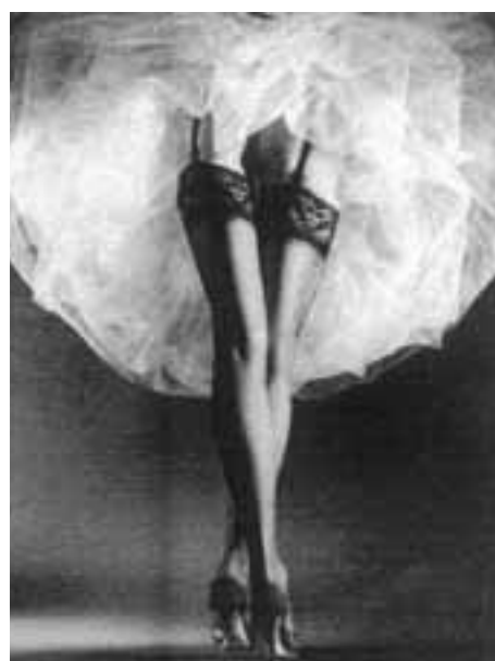
HORST P. HORST »Round the Clock«

Fotografija je kao umjetnički medij kod većine naših ljudi, etablirana u tjeđnim časopisima ili dnevnim novinama i to najčešće kada fokusira društvenu ili političku senzaciju. Povijesni razvoj fotografije u