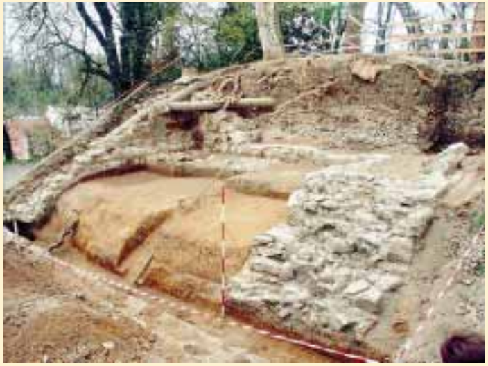
OSTACI SREDNJOVJEKOVNE JUGOZAPADNE GRADSKO KULE: Je li kula, osim obrambene, imala i neku drugu namjenu

Gradsko općina 26. siječnja 1487. ustupila je pavlinskom samostanu iz Remeta da u kuli otvori gostionicu pod uvjetom da je obnove i učvrste, a u slučaju neprijateljske opsade da ju ustupe gradu za obranu. Zauzvrat grad ih je oslobodio svih godišnjih gradskih poreza i daća te čuvanja grada (stražarenja) i tlake