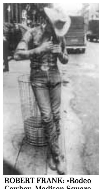
ROBERT FRANK: »Rodeo Cowboy, Madison Square Garden«, 1955.