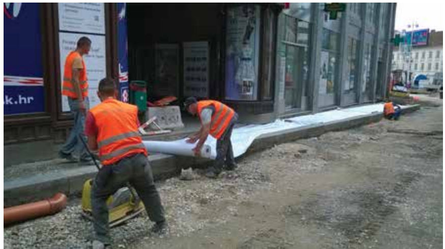
Postavljanje geotekstila na nogostup

Debljina tamponskog sloja od drobljenoga kamenog agregata iznosi 40 cm na kolniku te 25 cm na nogostupu. Na tampon na kolniku potom je postavljena cementna stabilizacija debljine 25 cm, a na nogostupu ona iznosi 15 cm.