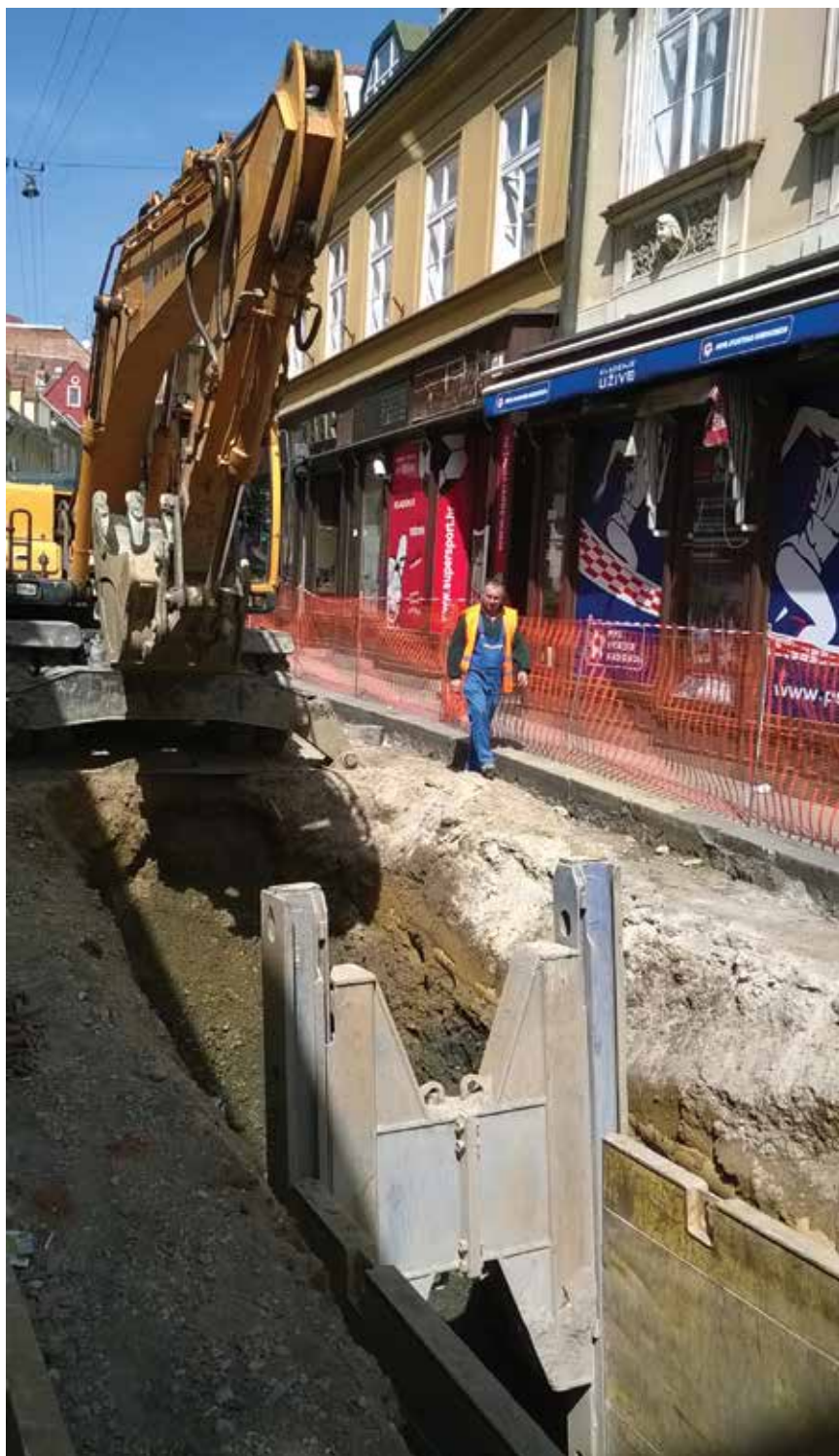
Detalj s gradilišta

Radovi na obnovi Radićeve, čije je trajanje predviđeno najmanje šest mjeseci, naišli su na veliko neodobranje obrtnika koji tamo posluju jer se boje gubitka klijenata, a time i zarade. Iz Poglavarstva Grada Zagreba stiglo je obećanje da će se pomoći svim obrtnicima, a financijska pomoć uključuje oslobađanje plaćanja komunalne naknade i najamnine. Stanari pak pozdravljaju uređenje ulice jer su svjesni, kako sami kažu, da je ta ulica prije uređenja izgledala kao "zeleni spust na Sljemenu poslije skijaške sezone". U Gradu smo doznali kako će se na rubu obnovljenog dijela Radićeve ulice koji pripada pješačkoj zoni, kod kućnog broja 42, postaviti automatski podizni stupići. Dozvolu za promet osobnim vozilima obnovljenim dijelom Radićeve ulice imat će samo oni stanari i vlasnici ili zakupci poslovnih prostora koji su i do sada imali osigurana parirališna mjesta u vlastitim dvorištima. Na taj su se potez odlučili jer su tijekom pripreme radova u Radićevoj ulici uočili da njome, unatoč tomu što je riječ o pješačkoj zoni, teče intenzivan promet vozilima. Nadalje, osim stanara koji imaju dozvolu za ulazak u pješačku zonu radi parkiranja u dvorištima, puno je dostavnih vozila koja koriste Radićevu za