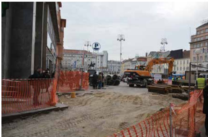
Detalj s gradilišta (na početku Radićeve ulice kod Trga bana Josipa Jelačića)

Radićeva ulica jedina od Trga bana Jelačića vodi izravno na Gornji grad, zbog čega je omiljena turistička trasa u Zagrebu. Prije obnove kolnik Radićeve ulice bio je popločan granitnim prizmama (četverostranim i peterostranim), odnosno kockama. Dimenzije manjih kocki su 8 x 8 x 8 cm, a dimenzije prizmi su od 18 x 12 x 16 – 20 cm do 28 x 18 x 16 – 20 cm. Peterostrana prizma postavljena je jedino na početku Radićeve ulice, u dužini od približno 3 m, dok je u ostatku ulice postavljena četverostrana. Jedan dio ulice bio je popločan kockama, dok je dio prema sjeveru asfaltiran. Ukupna površina kolnika iznosila je 1786 m 2 , od čega je površina s granitnom kockom i prizmom bila 1690 m 2 . Dio prema Kamenitim vratima popločan je granitnim kockama i prizmama, na način da su prizme postavljene u sloj pijeska i fugirane također pijeskom, a koji je u dobrom dijelu bio ispran. Površina nogostupa u asfaltu iznosila je 1078 m 2 ,