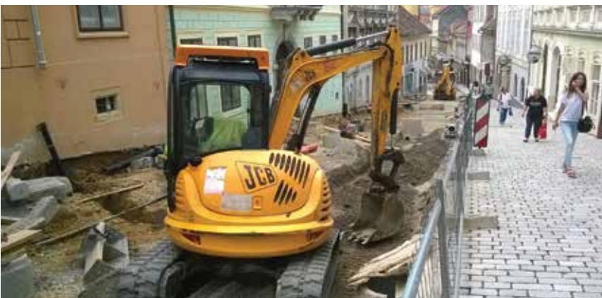
Sadašnji, najčešći izgled ulice

riječ o pješačkoj zoni, potrebno je postaviti stupiće kako bi se regulirao promet i povećala razina sigurnosti pješaka. Uz njih, postaviti će se dvije kamere koje će ulicu snimati danonoćno, a funkcionirat će tako da će prepoznavati registarske oznake vozila vlasnika s dozvolom te će svima onima koji uđu bez dozvole na kućnu adresu biti poslani prekršajni ka-