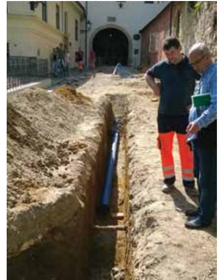
Premještanje instalacija prema Kamenitim vratima