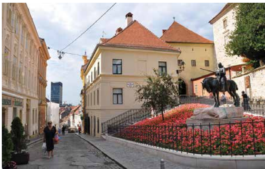
Vidljiva oštećenja postojećeg kolnika

Radovi na obnovi Radićeve ulice obuhvaćaju premještanje komunalne infrastrukture (kanalizacije, vode i plina), sanaciju elektroenergetske mreže i elektroničkoj komunikacijskoj infrastrukturi (EKI) sa svim priključcima