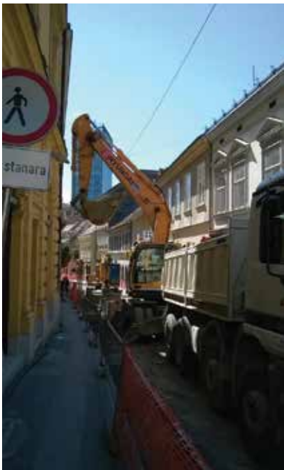
Zbog uske ulice otežano je kretanje strojeva

Debljina tamponskog sloja od drobljenoga kamenog agregata iznosi 40 cm na kolniku te 25 cm na nogostupu. Na tampon na kolniku potom je postavljena cementna stabilizacija debljine 25 cm, a na nogostupu ona iznosi 15 cm.