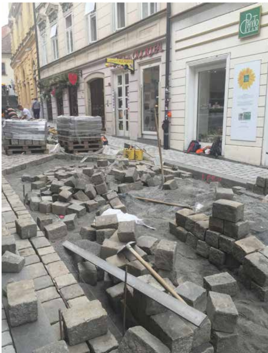
Postavljanje kocki na kolnik

nirani broj šahtova kako bi se prespojila sva oborinska odvodnja. Problem gradilišta bio je intenzivan pješački promet. Iako je gradilište ograđeno, svakome stanaru trebalo je omogućiti prilaz do zgrade, a to je usporavalo radove. Tijekom radova svi stanari s povlaštenim parkirališnim kartama za Gornji grad dobili su pravo na parkiranje u 1. zoni. Radovi su se izvodili na dubini od četiri metra, u vrlo uskoj i strmoj ulici, pod izni-