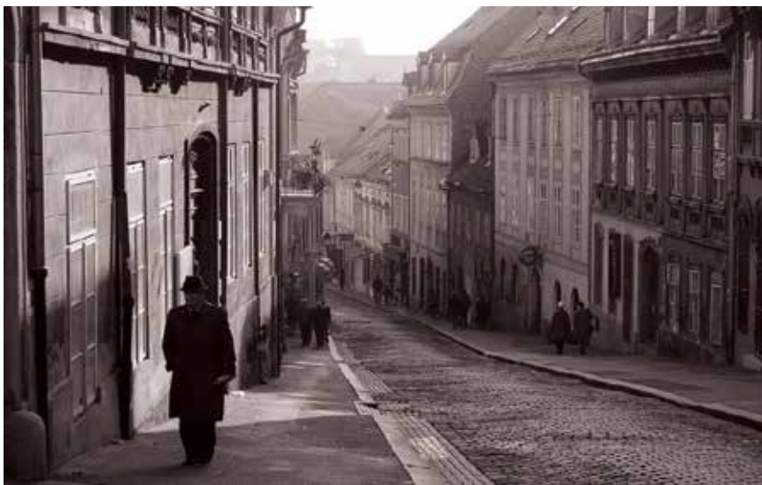
Nekadašnji izgled Radićeve ulice

Na broju 12, u kući klobučara Primusa Kostelca od 1797. nalazilo se sjedište Typographie Novosel , tiskare biskupa Vrhovca. U toj je kući 1852. Ljudevit Gaj otvorio Narodnu knjigarnicu s prilično ambicioznim programom: od ponude knjiga na glavnim europskim jezicima, nota, umjetnina i antikviteta te pribora za pisanje preko uspostavljanja suradnje s knjižarama u domovini i srednjoj Europi te tvornicama raznog pribora i galanterije do promocije književnosti slavenskih naroda kao posebnog cilja. Zacijelo najvažnija bila je tiskara Karla/Dragutina