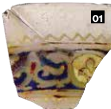
01 Ljiljan, simbol anžuvinske dinastije na staklenoj krhotini;