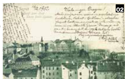
02 Razglednica iz razdoblja poslije 1900.; 03 Južna promenada na veduti Gornjega grada iz Mape Zagrebačke biskupije Josipa Szemana iz 1822.; 04 Arheološki radovi u parku