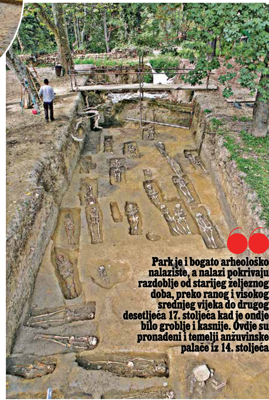
Park je i bogato arheološko nalazište, a nalazi pokrivaju razdoblje od starijeg željeznog doba, preko ranog i visokog srednjeg vijeka do drugog desetljeća 17. stoljeća kad je ondje bilo groblje i kasnije. Ovdje su pronađeni i temelji anžuvinske palače iz 14. stoljeća

ZELENI OTOCI Promjene i povijest Južne promenade, od 1874. Strossmayerova šetališta, mogu se udobno pratiti prema dokumentima sve do velike transformacije 1913., iza koje stoji arhitekt Hugo Ehrlich, dok o Parku Grič postoji malo doku-