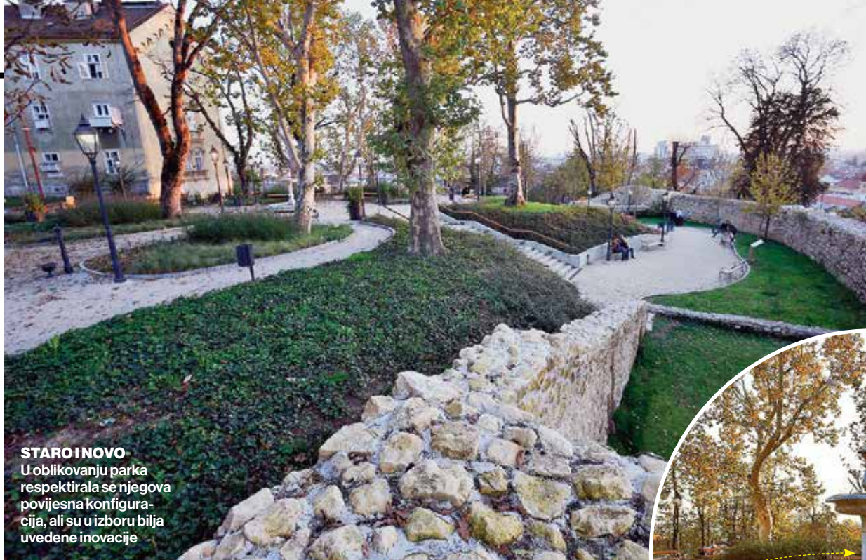
STARO I NOVO U oblikovanju parka respektirala se njegova povijesna konfiguracija, ali su u izboru bilja uvedene inovacije

REMETSKI PAVLINI Možda su banova inicijativa i dotad najveći gradski projekt bili potaknuti promjenom koju je doživio sklop nekadašnjeg kapucinskog samostana i kurije remetskih pavlina, sagrađen na južnom bedemu sredinom 17. stoljeća (na