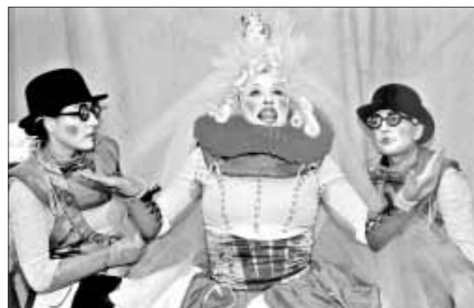
Nagrada za najbolju kostimografiju: »Kresivo« Dječjega kazališta u Osijeku

KNJIGE – Predstavljeno djelo Viktora Žmegača »Književnost i glazba«